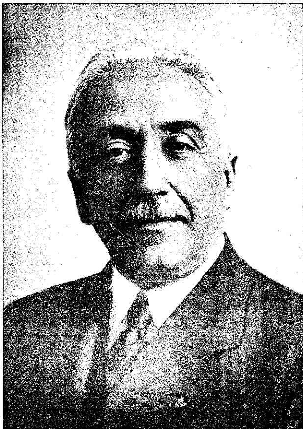
Excmo. Sr. D. Niceto Alcalá Zamora