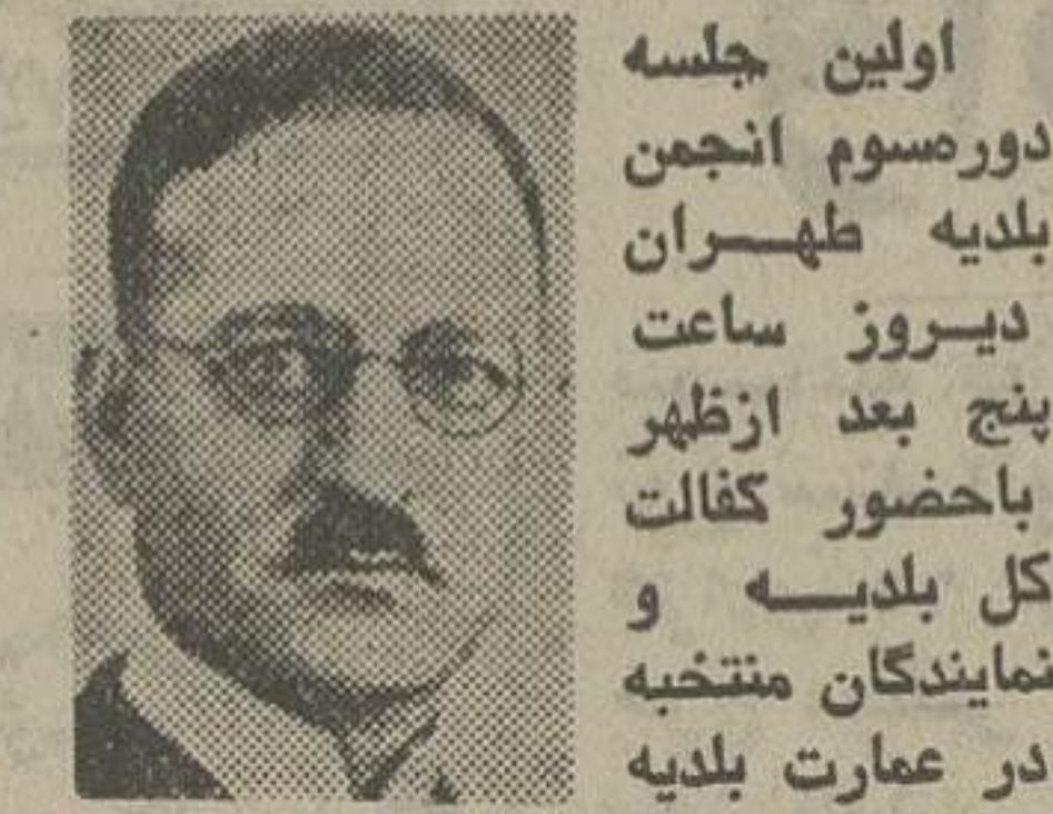
حکیم الدوله ادهم