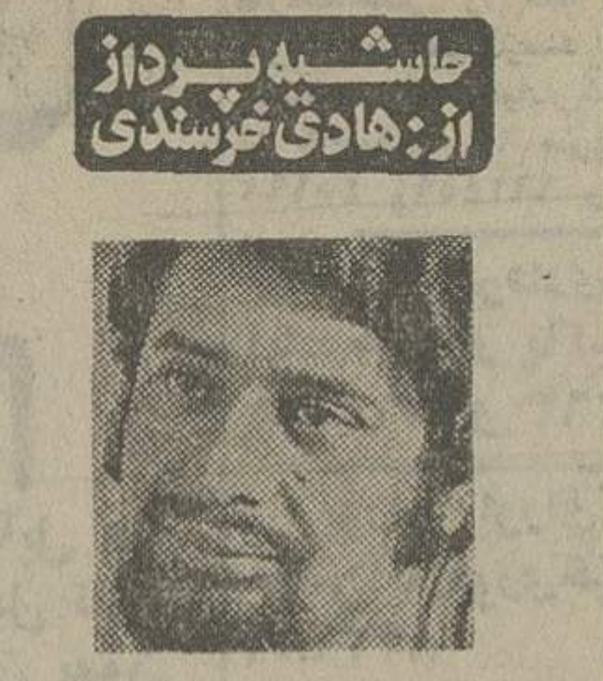
حاشیه پندار از: هادی خورشیدی

در این اواخر دو سه موسسه انتقالی وابسته به دولت سن بازنشستگی را بالا برده اند. بدست خدمت، برای بازنشستگی افزوده اند گویا برای بازنشستگان سربسته سابق خدمت یا شصت و پنج سال عمر را لازم داشته اند!