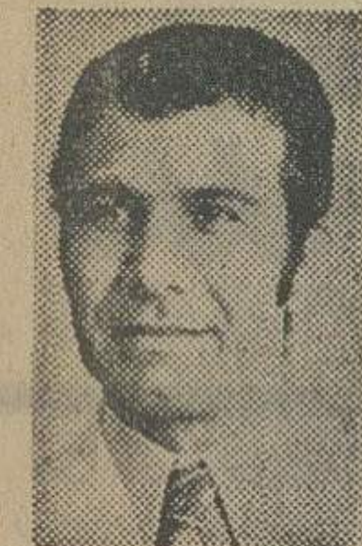
گزارش از: فرزین فتانین