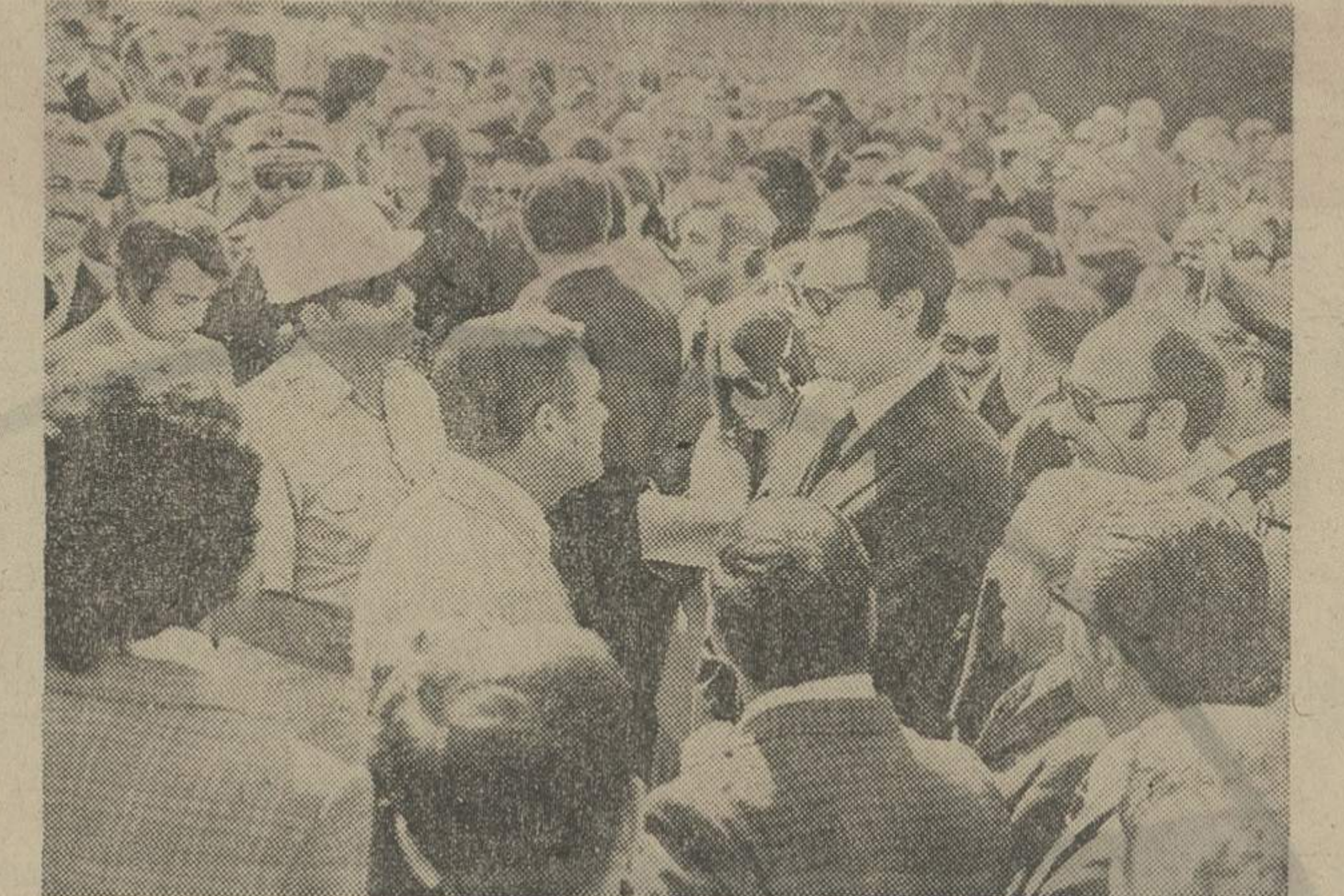
والا حضرت شاهپور محمودرضا پهلوی با آقای ریچارد دک مدیر شرکت و کاپیتان اسماعیل فرامرز مدیر داخلی شرکت و کاپیتان کشتی صحبت می کنند.