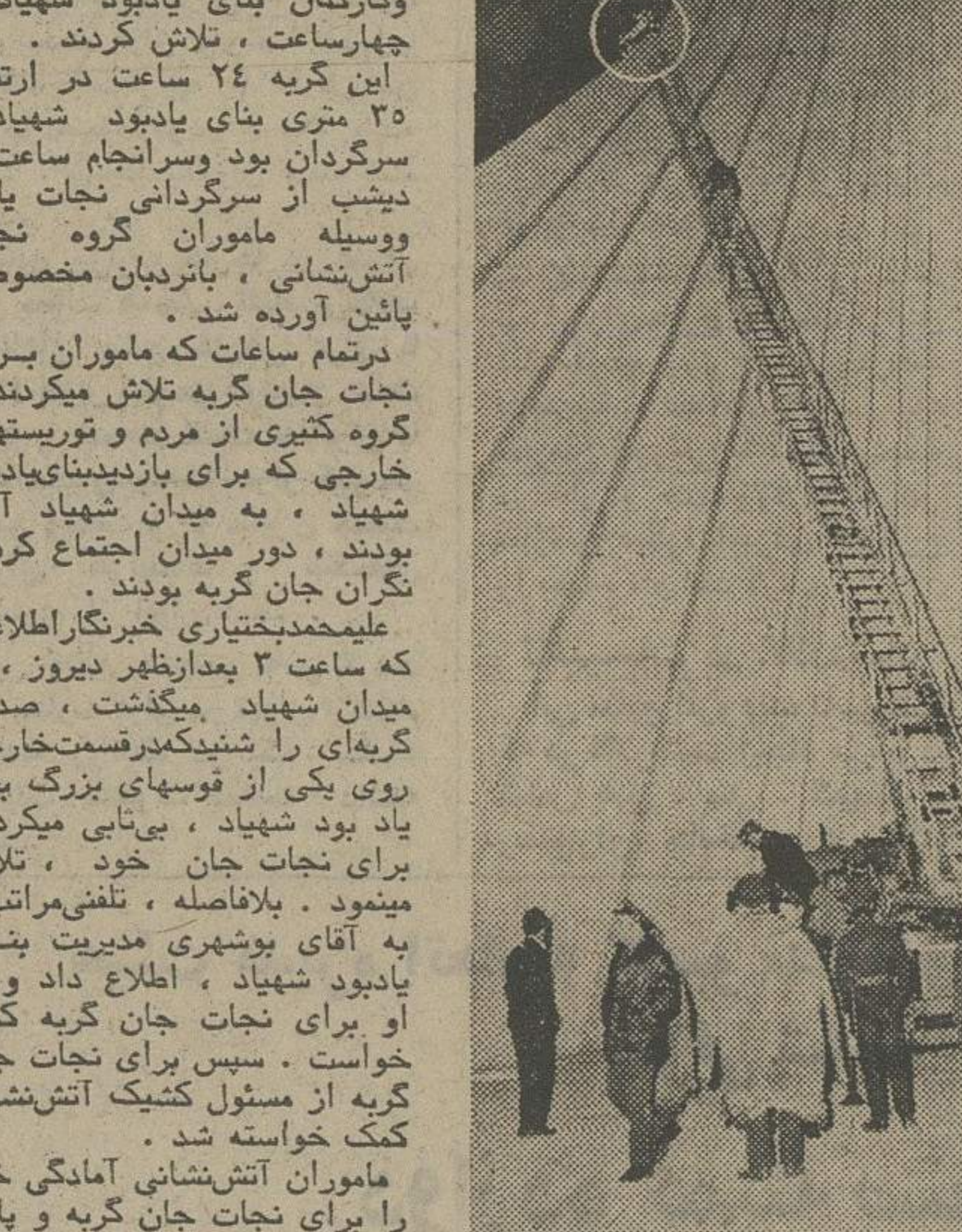
امدادگران آتش نشانی، تلاش میکنند تا گر به را بگیرند آنها احتیاط میکنند تا گر به بعلت ترس و وحشت بیائین سقوط نکند چه در اینصورت گر به در ارتفاع بیش از سی متری بیائین می افتاد و متلاشی میشد.