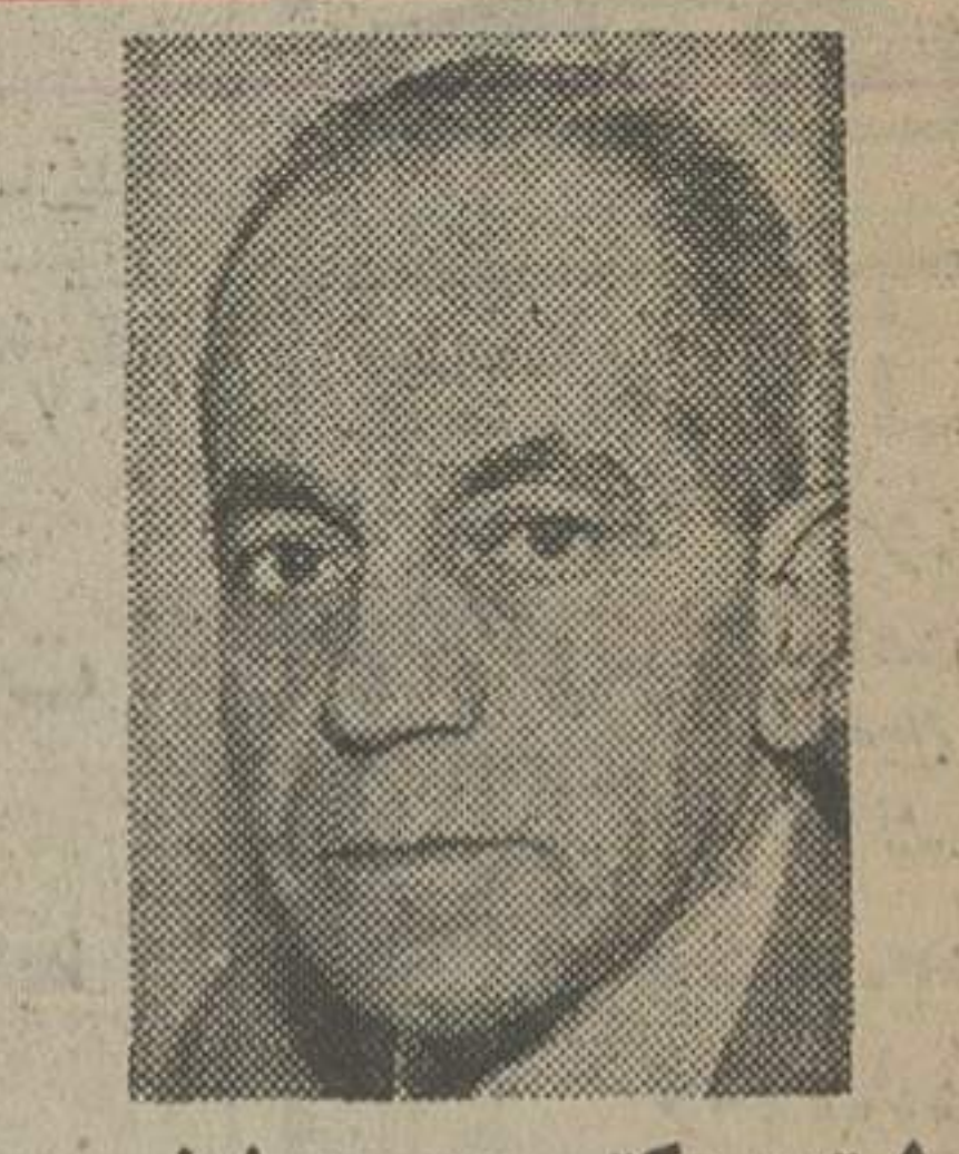
نوشته: دکتر محمود شفیعی

باین تصمیم، کارمندان یک راست به بهشت زهرا می روند!