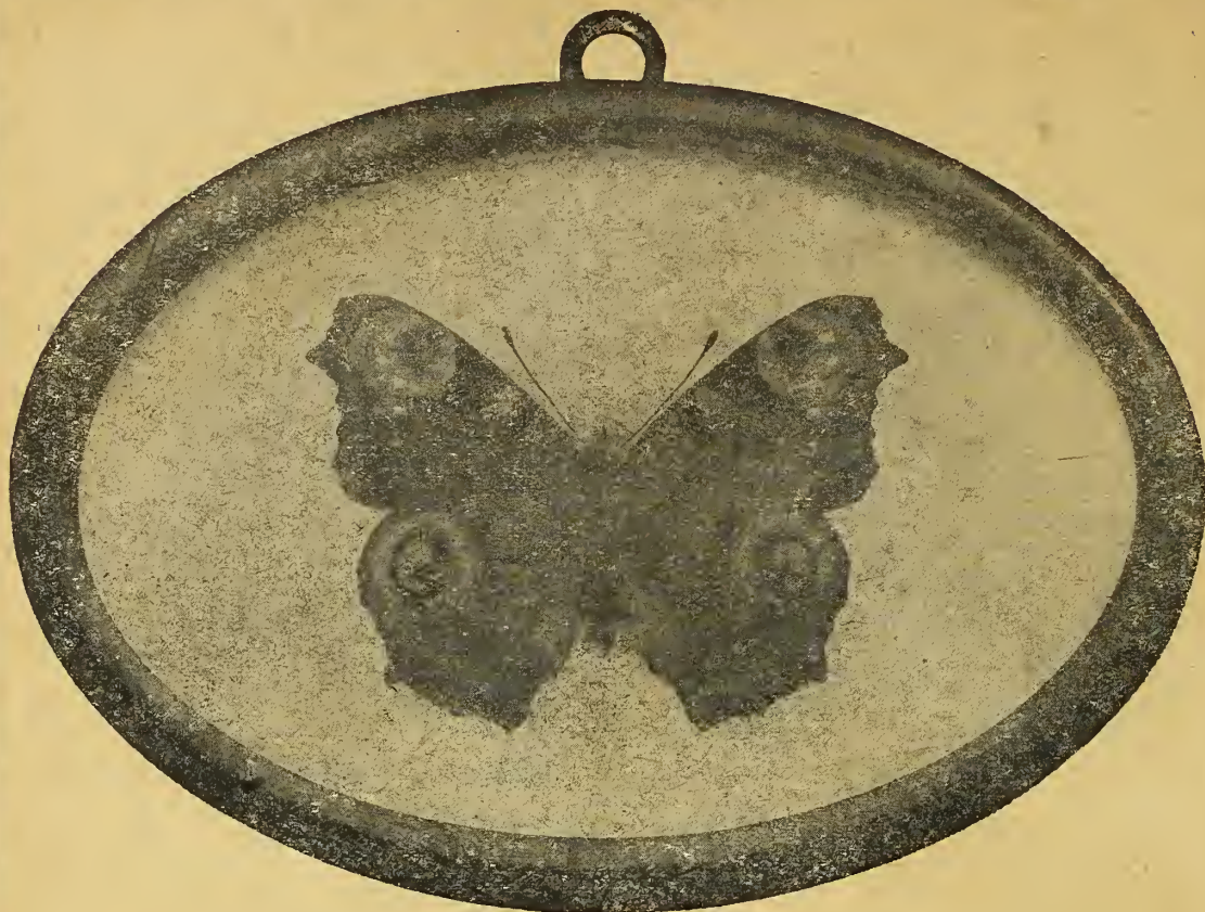
Rahmen Nr. 3. Originalgrösse.