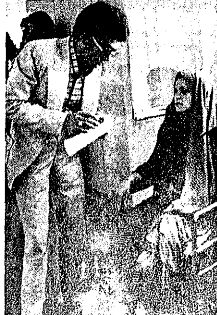
دختر جوان کشته، دختر خانه فاطمه که او هم کشته شد