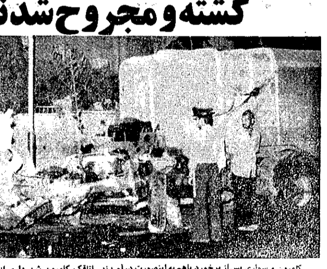
کامیون و سزاری پس از برخورد باهم به اینمورد در آمدند. اتفاق کامیون شهرداری از بدنه آن جدا شده است.

در یک حادثه رانندگی که شب گذشته در جاده آرمگاه بین یک کامیون شهرداری و یک سواری روی داد، راننده سواری کشته شد و کودکی ۵ ساله و راننده کامیون مجروح شدند. ساعت ۳ بامداد اسرروز هنگامیکه کامیون حمل زباله شهرداری منطقه ۲ به شماره ۹۵۸۸۵ از شمال سمت جنوب در جاده آرمگاه حرکت میکرد، بانواری فیات شماره ۶۷۹۹۵ تهران-ی که از سمت مقابل کامیون در حرکت بود تصادف کرد. شد تصادف به حدی بود که سواری بصورت آهن پاره ای درآمد و کامیون حمل زباله شهرداری درهم کوبیده شد.