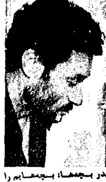
پدر بچه‌ها، بچه‌ها را سرایدار کشته، او بساید مجازات شود