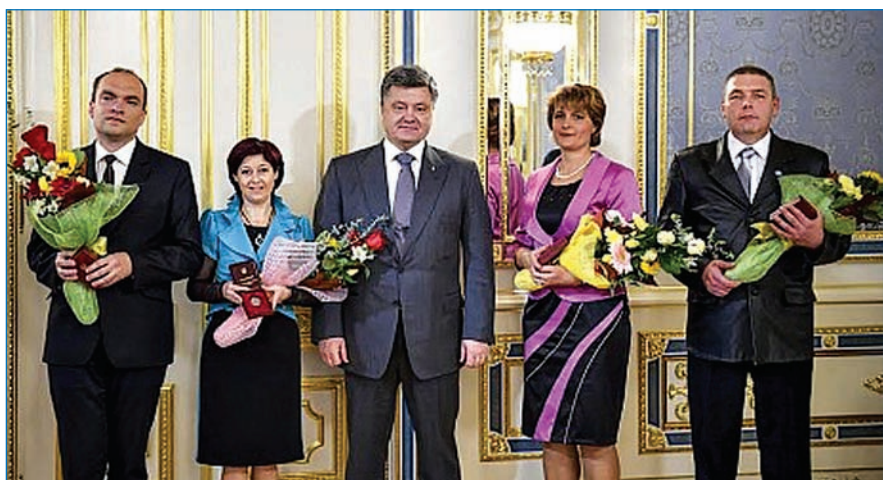
Напередодні Дня працівників освіти Президент України Петро Порошенко провів зустріч з переможцями Всеукраїнського конкурсу «Учитель року — 2014» та вручив їм державні нагороди (Детальніше — на стор. 12)