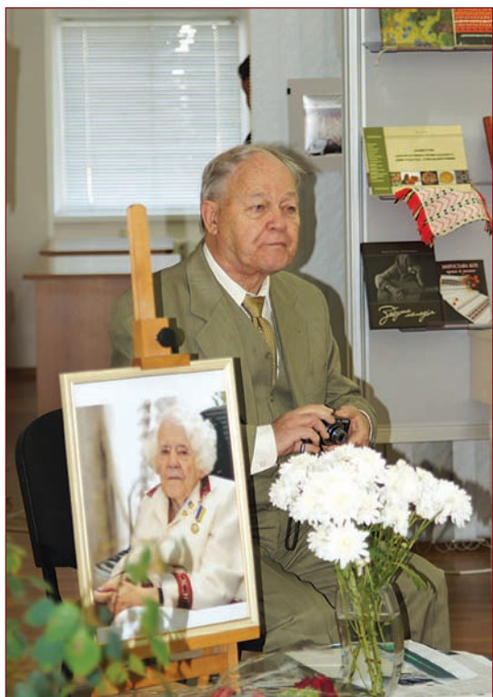
КРИМУ ДУША УКРАЇНСЬКА...