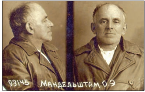
Осип Мандельштам після арешту в 1938 р.