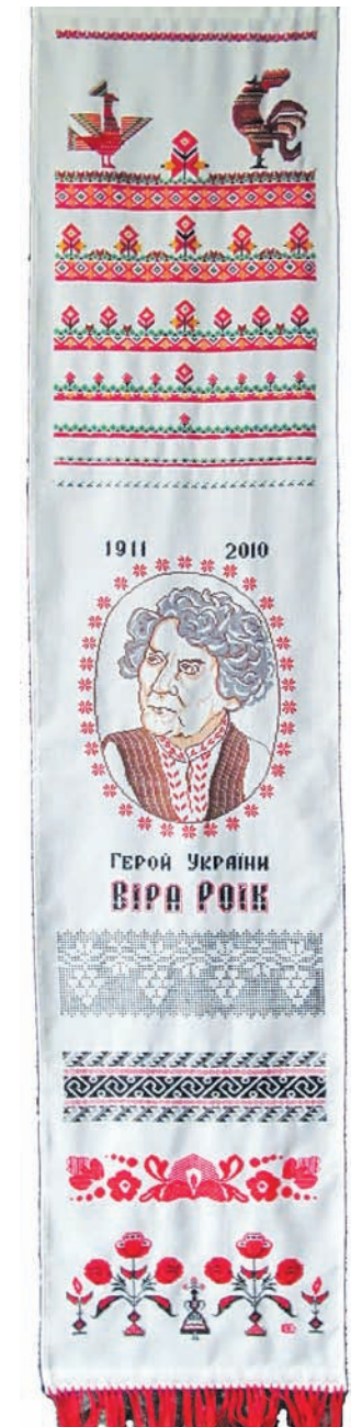
Рушник Юрія Савки