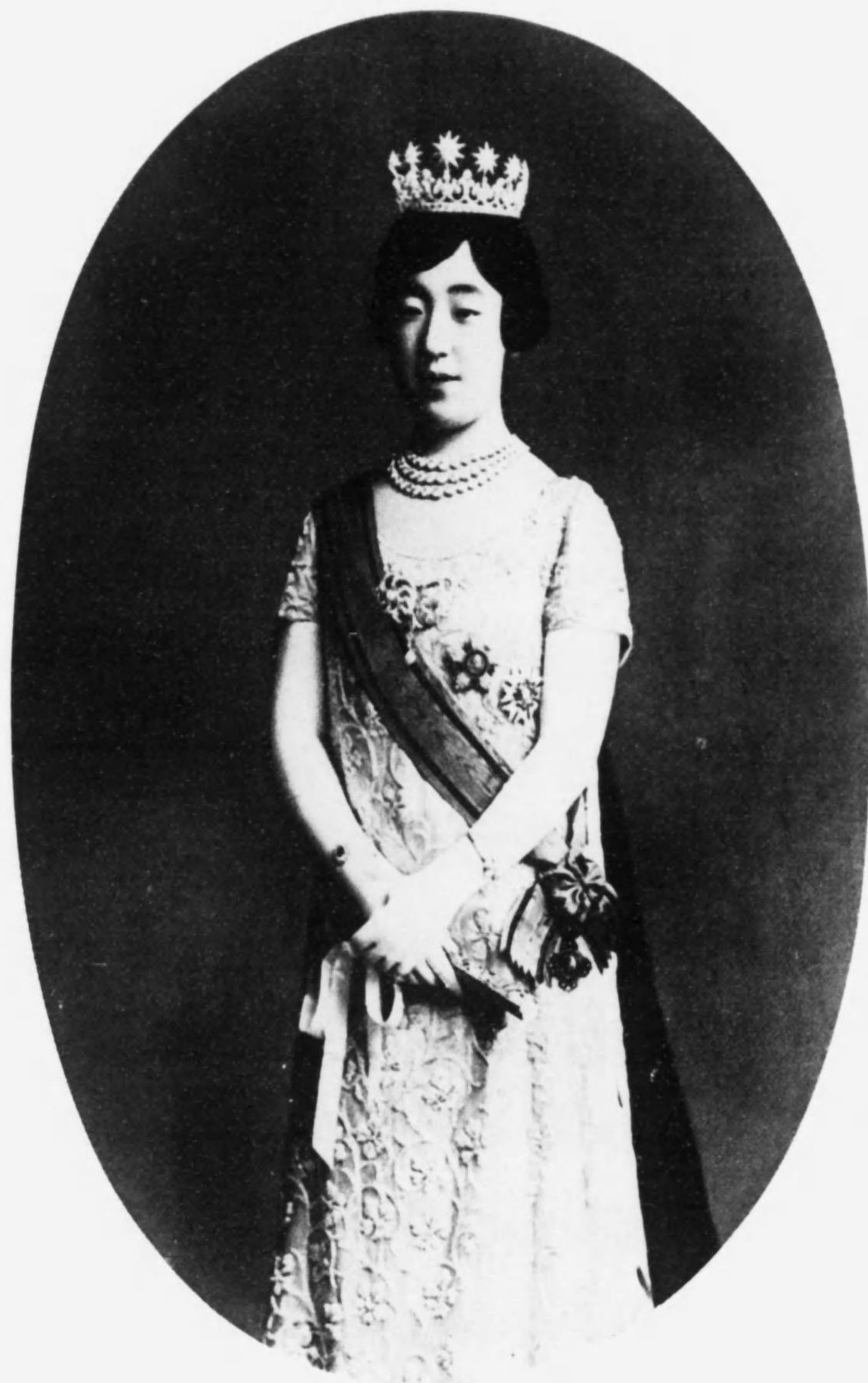
下 陛 后 皇