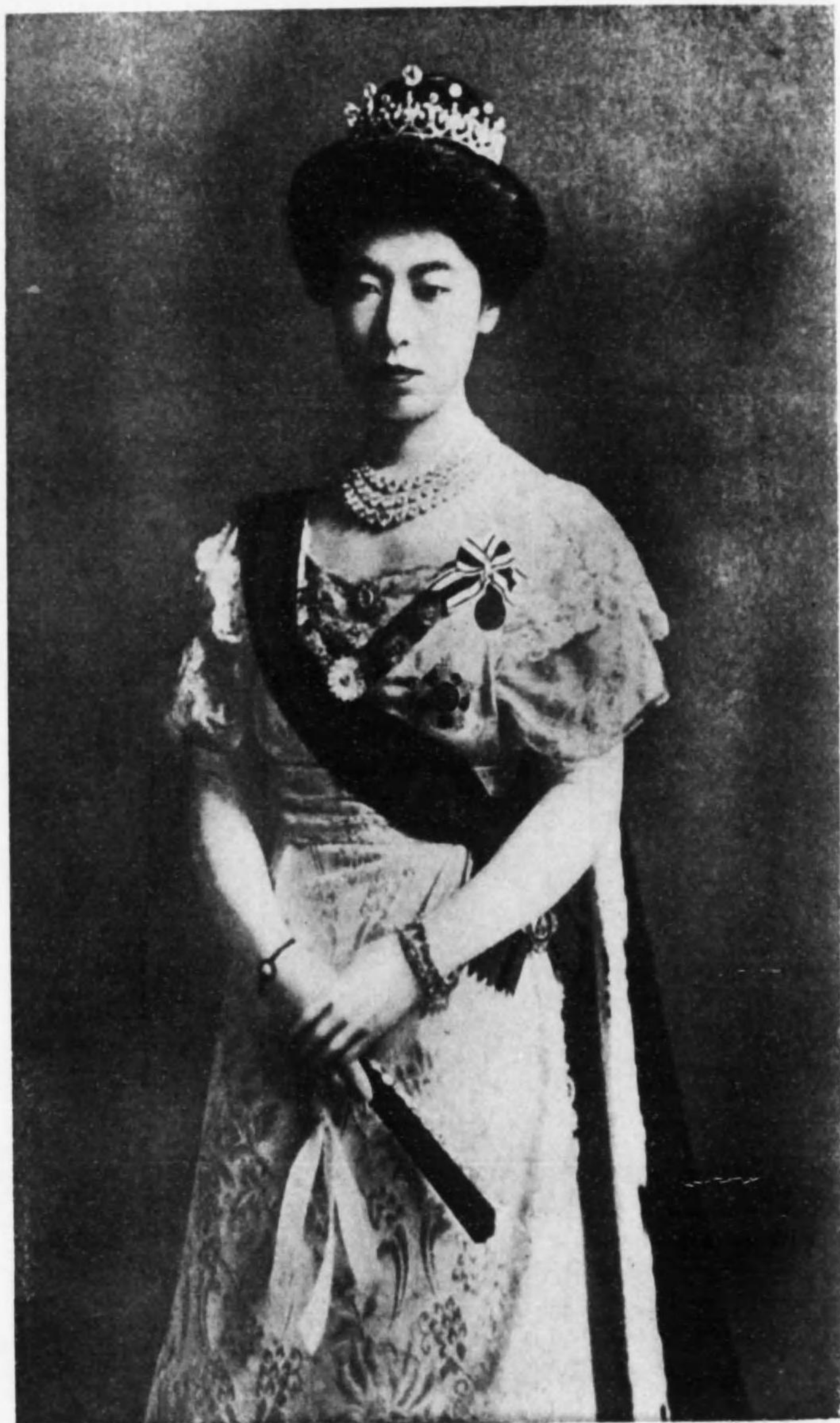
下 隆 后 太 皇