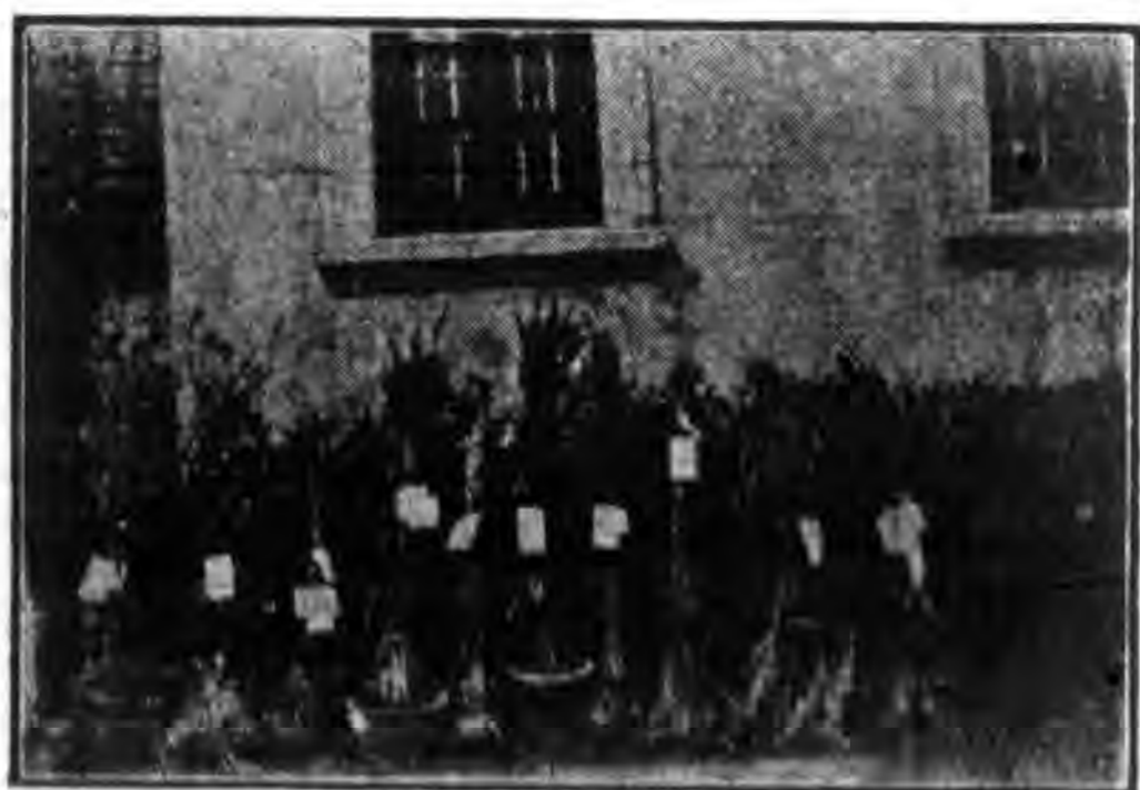
覽展品產農業糖次一第縣山台 圖獎獲勝優類麥