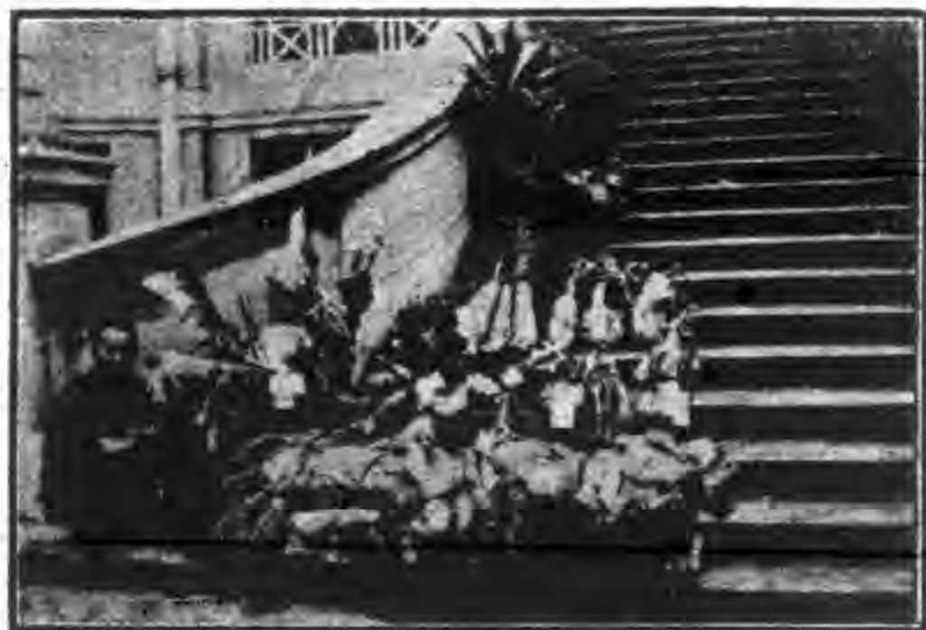
覽展品產農業糖次一第縣山台 圖獎獲勝優類菜蔬