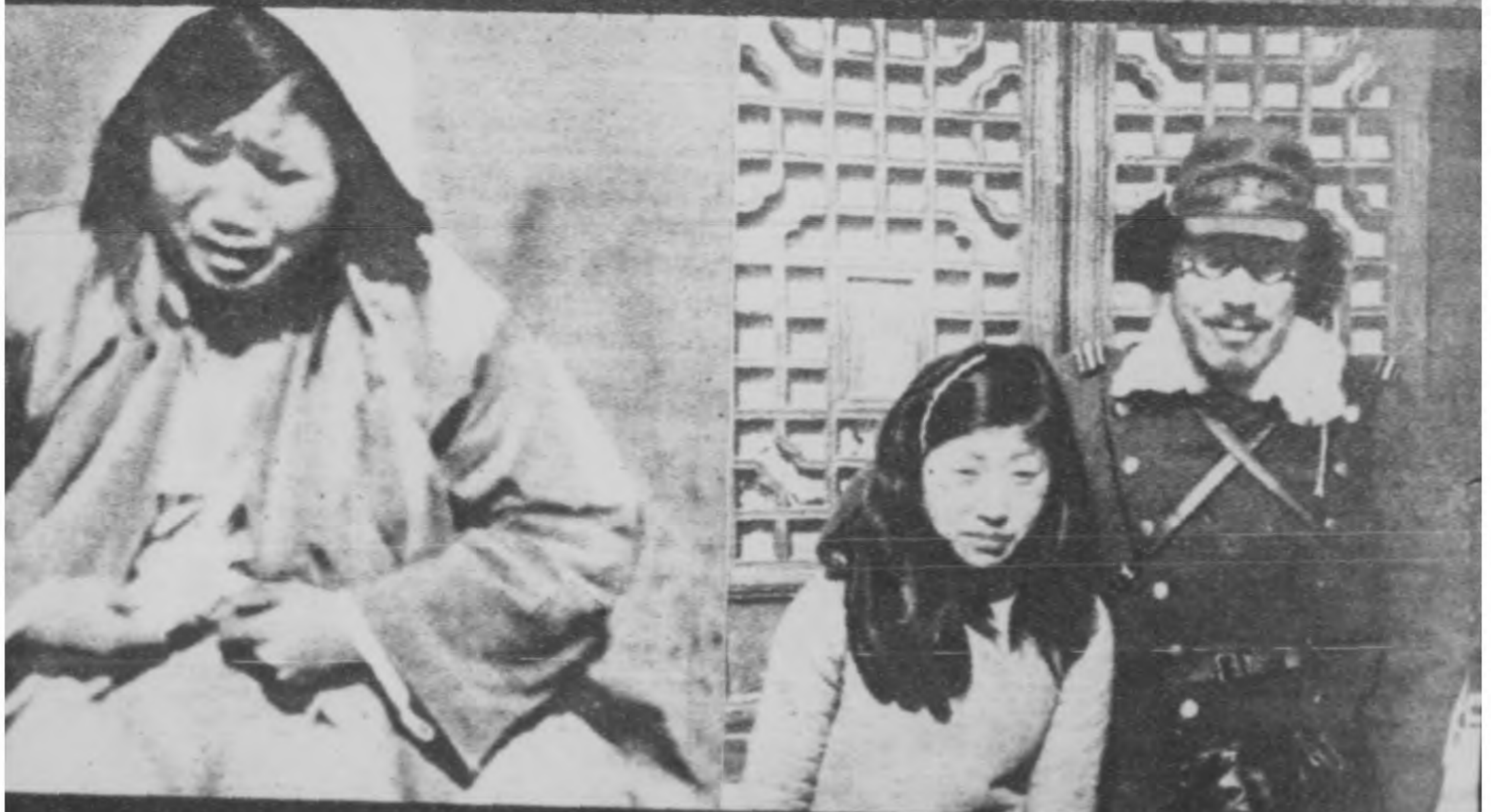
！辱凌的道人無慘此受甘，妹姊女妻無誰