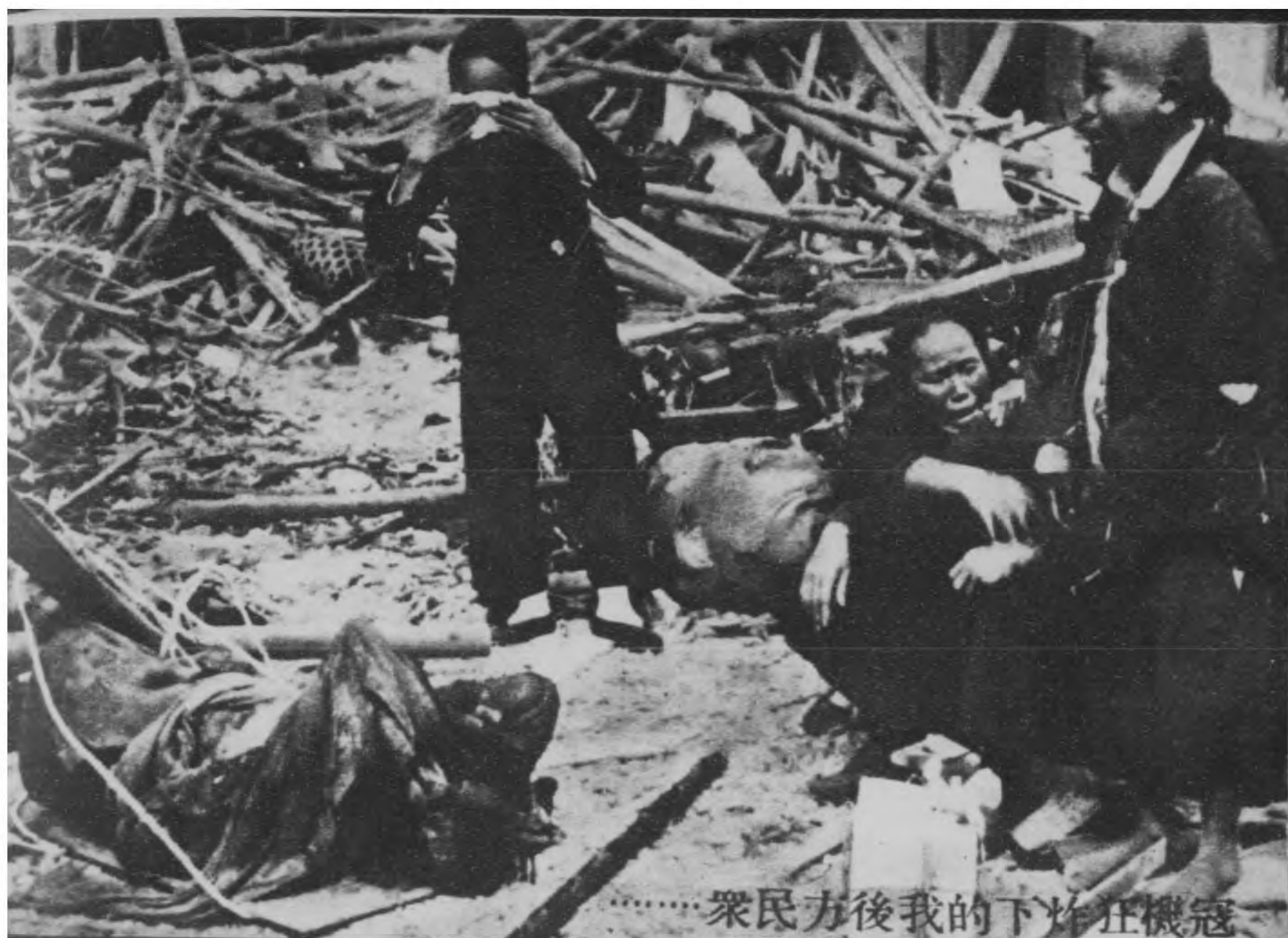
……眾民方後我的下炸狂機寇