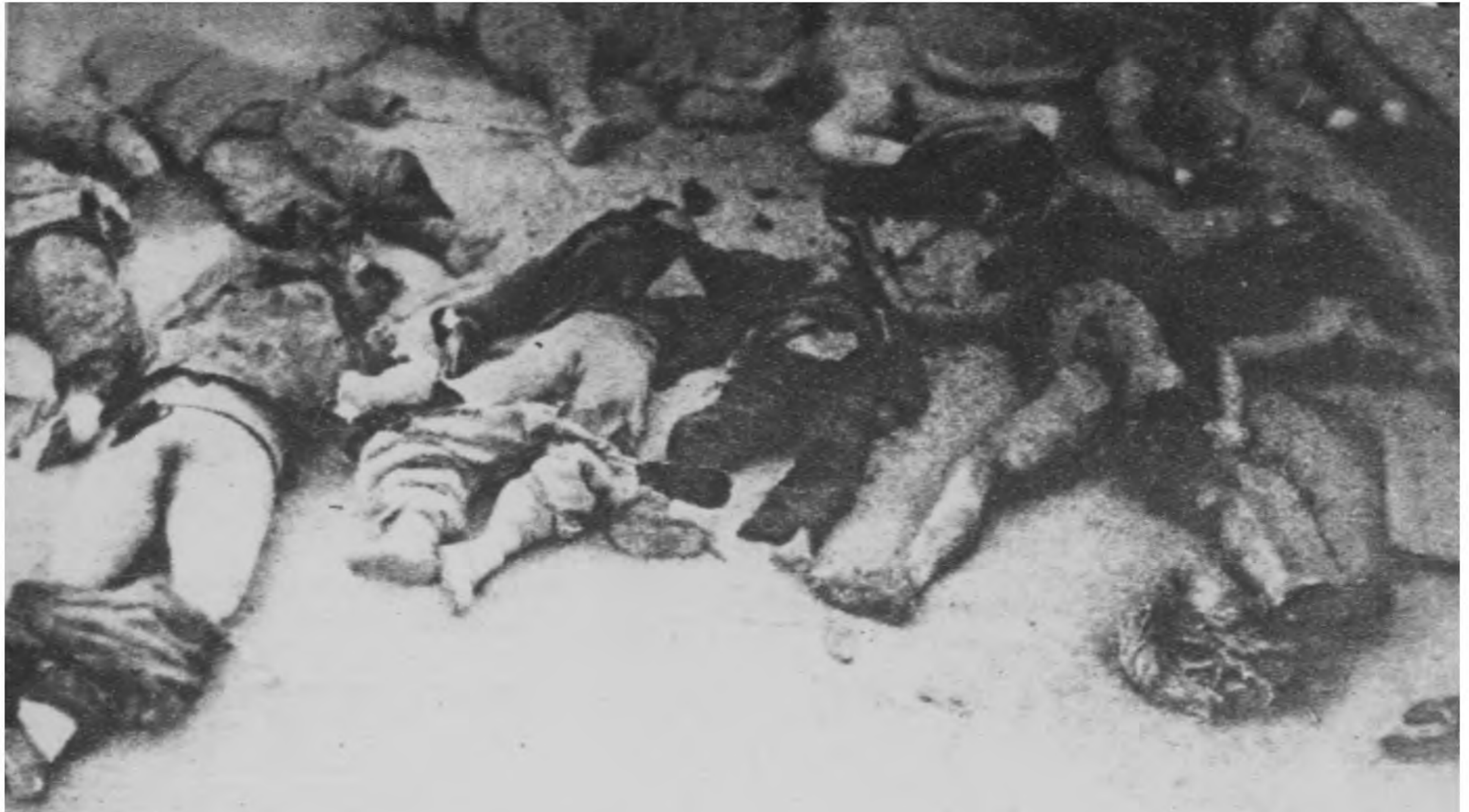
山西鄉十個女個女八婦二縣武山 ！解再姦孩個女個十鄉西