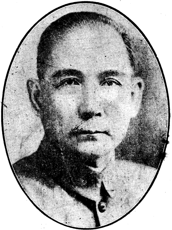
總 理 遺 像