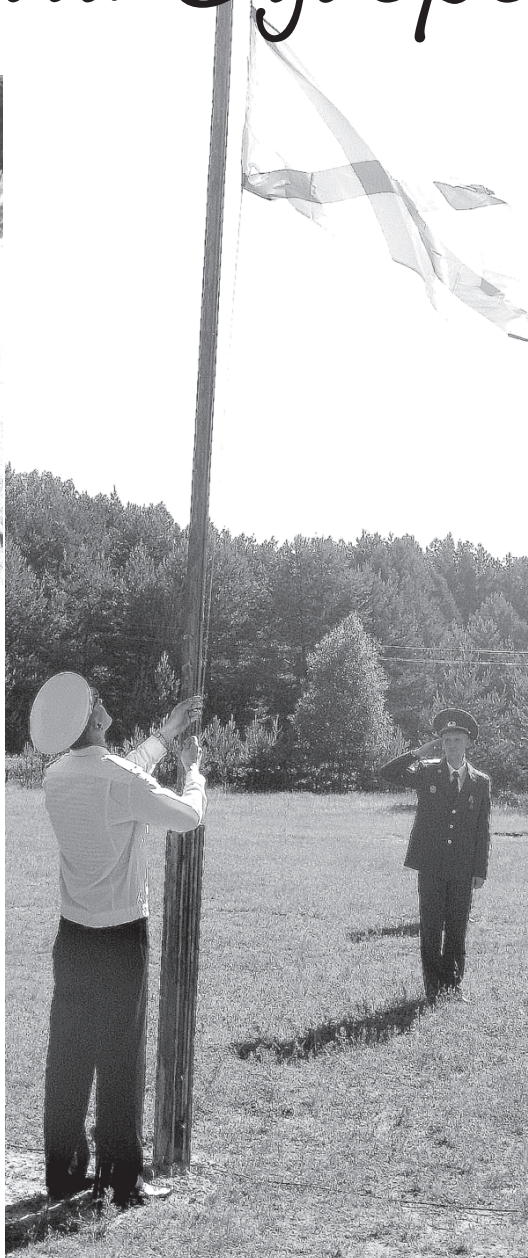
Поднятием Андреевского флага ознаменовалось открытие лагеря.