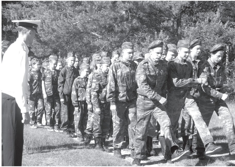
На Кухмаре во вторник состоялся заезд детей в выездную военно-спортивную смену, проводимую в рамках ежегодного Суворовско-Ушаковского похода.