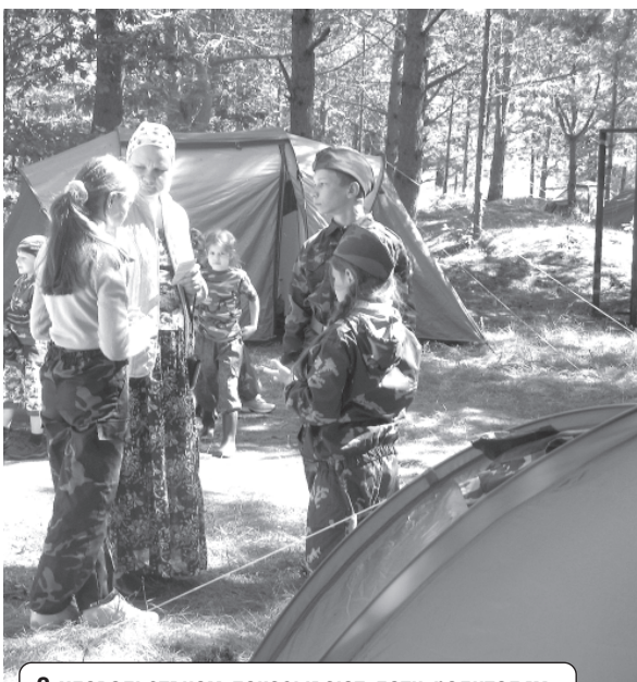
С удовольствием показывают дети родителям, как они живут в лагере.