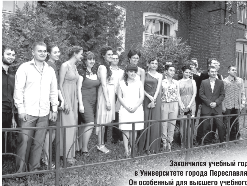
Закончился учебный год в Университете города Переславля. Он особенный для высшего учебного заведения - ему исполняется 20! Вот они - вчерашние студенты, а сегодня уже стопроцентно устроенные специалисты