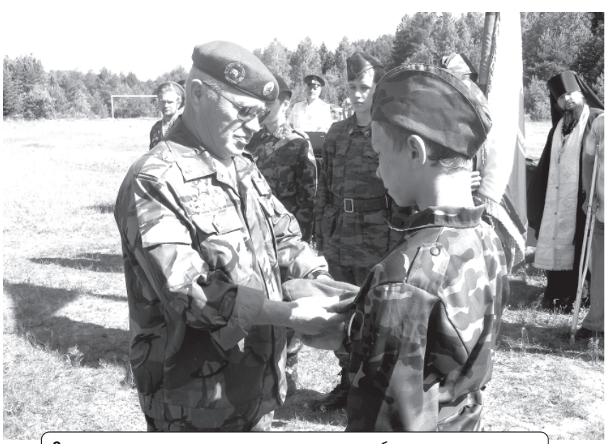
Стучит в волнении сердечко мальчишки, когда берет он в руки насто- ящий краповый СОБРовский берет.