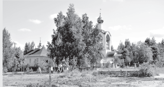
Уже в обед понедельника у храма Георгия Победоносца только пятно свежей разровненной земли напоминало о недавней коммунальной аварии