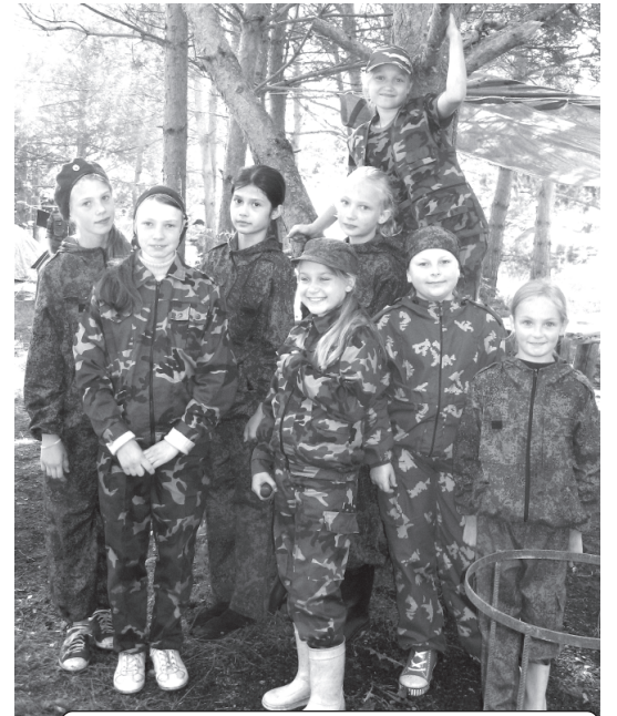
Симпатичные девчонки в банданах, беретах и бейсболках готовы ко всем нелегким занятиям!