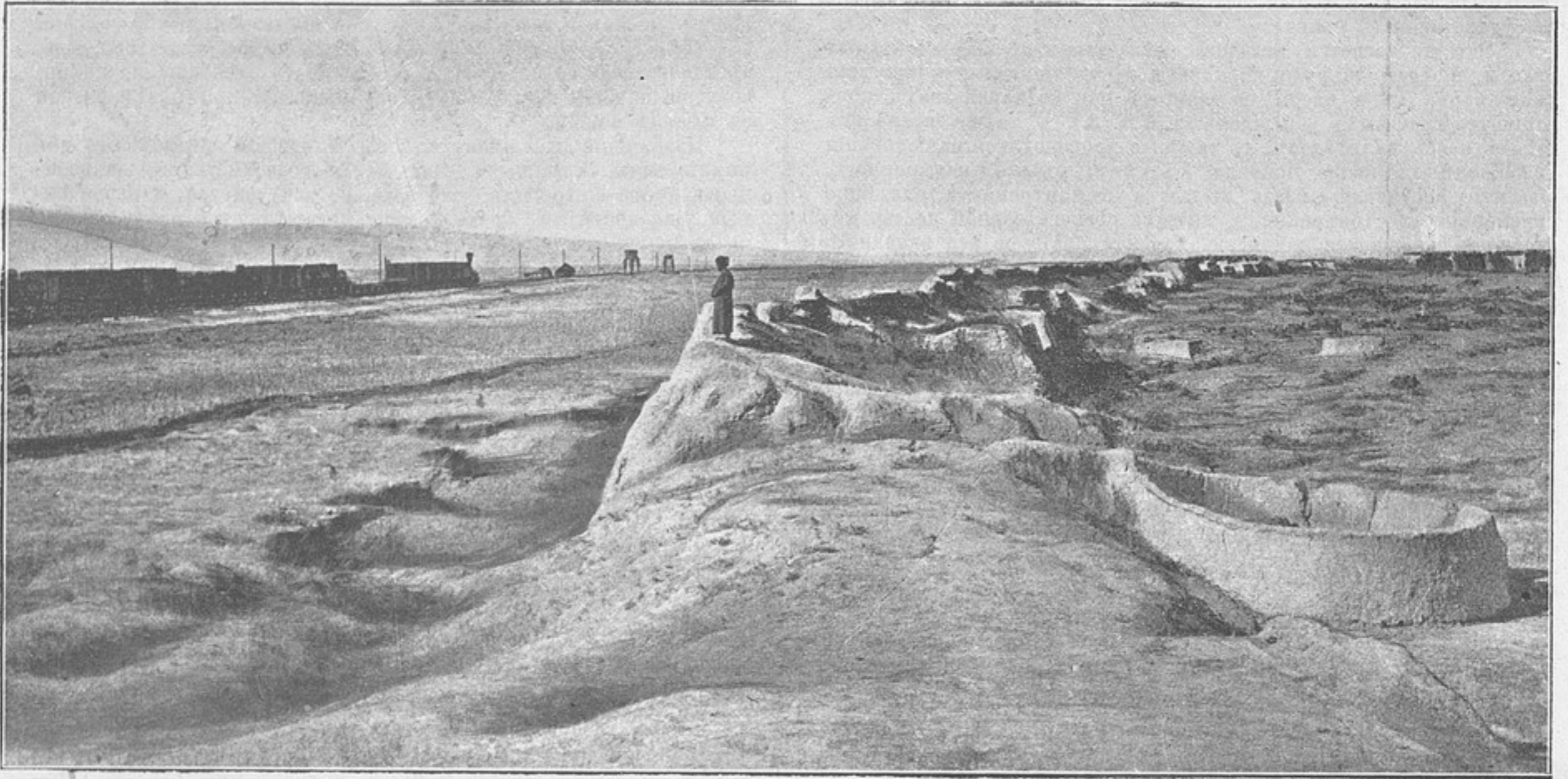
Развалины Гёкъ-тепе (къ статьѣ «Развалины Закаспійской области»).

Солдаты, любясь на старика-кавалера, увѣрены, что съ