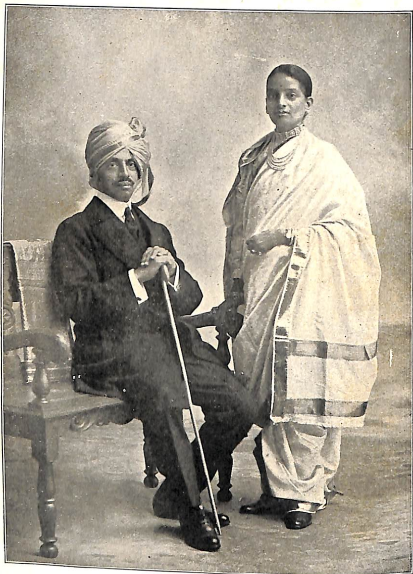
इचलकरंजीचे अधिपति आणि राणीसाहेब.