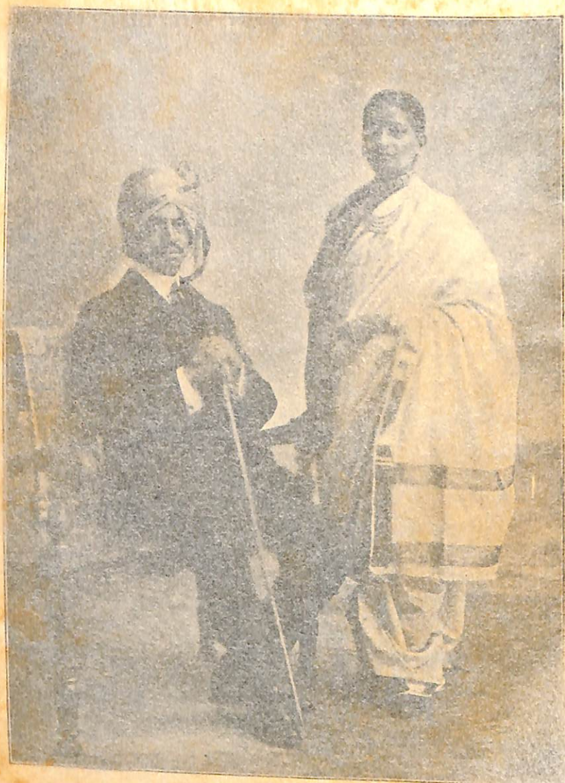
इचलकरंजीचे अधिपति आणि राणीसाहेब