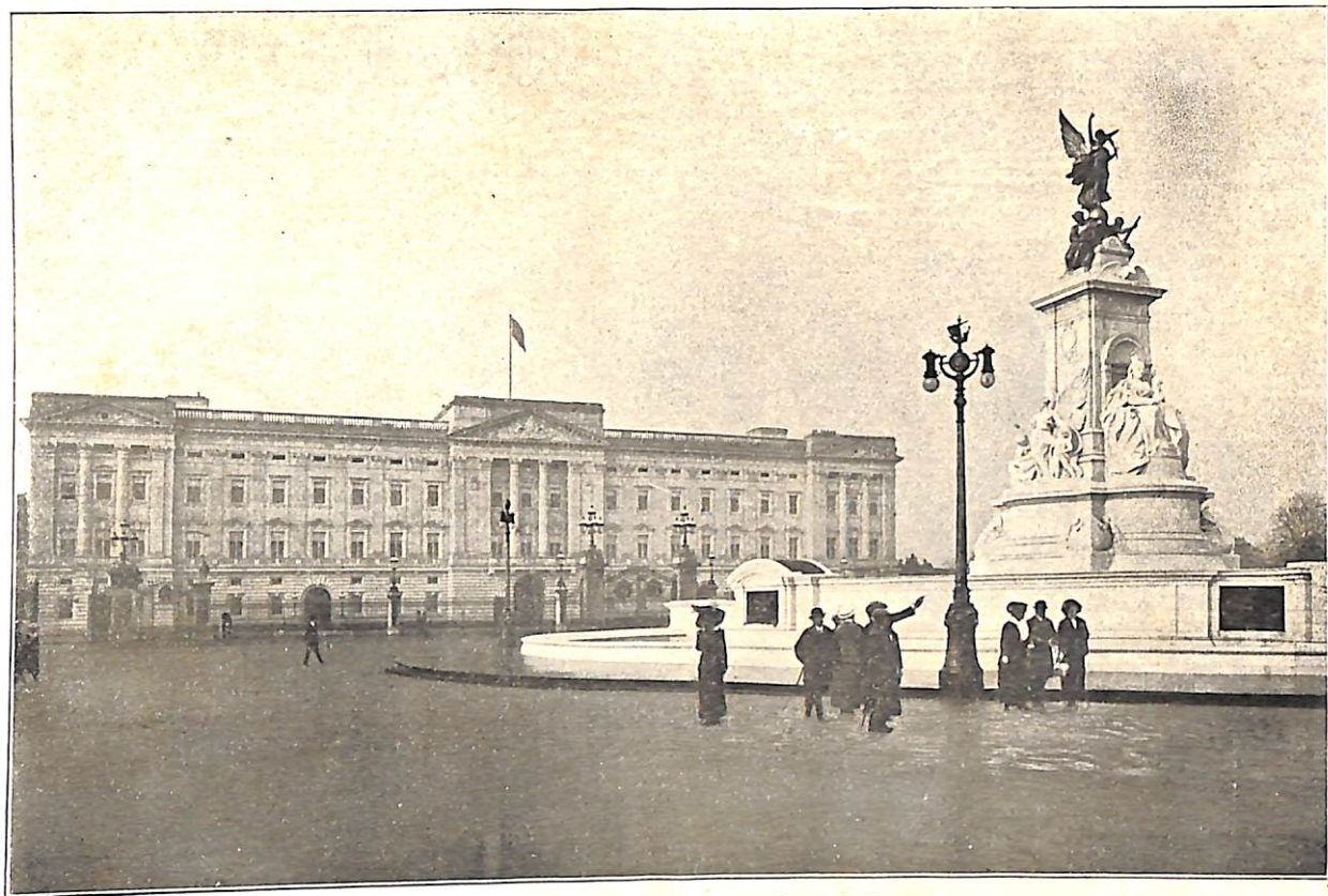
बकिंघम राजवाडा. महाराणी व्हिक्टोरिया यांचें स्मारक.