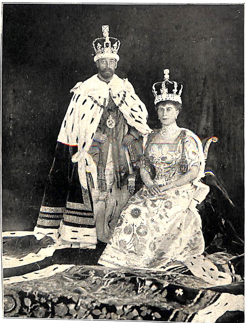
सम्राट् पांचवे जार्ज आणि महाराज्ञी.