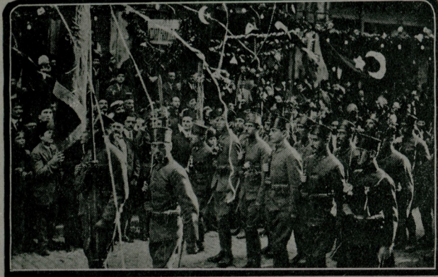
بک ارغیلک شاکساری : عسکرلریمزک اوستنه صرپاتینلر دوکولوکون