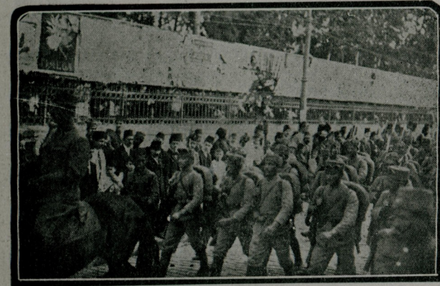
تقسیم قشله سی اوکننده : کچید رسندن بر سفحه