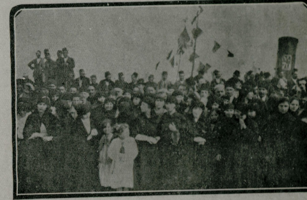
استانبول خلقدنده هیجان نظارهاری : تورپی اوستنده