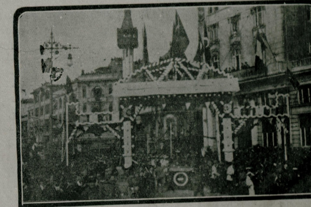
هیجان آتاهلر ایشدن : قره کوریده سویتج معشری