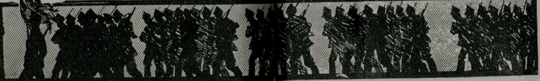
اک طیبی حقی ظفر اولان دمیر اردوسنک افرادشالی شجاعتلرک آرقه سنده یورویش حالتده