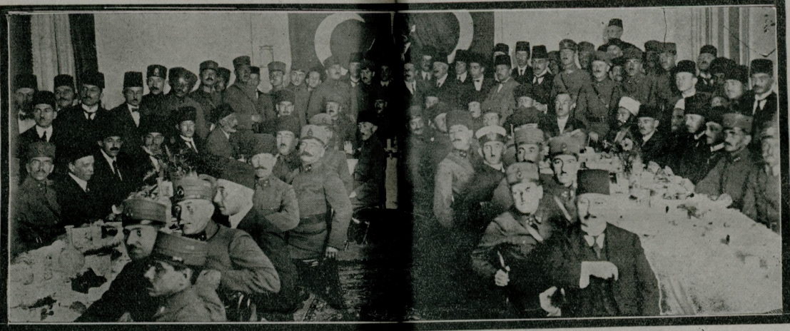
استانبولک استخلاسی شرفنه شهر امامتی طرفندن قایم دائره بلدیه سنده هیئت میموردنه فرماندا هیئتله شایسته ورینلر شایسته

عالمی دولتک یذنجی پادشاهی فاتح سلطان محمد یالین قیلنج یکچریلرینک اوکنده برانسک بر قابوسندن ایجری آردینی کون قرون وسطی نهایت بولدی ، صلب عالی او زمانه ندر تورکی ای طایموردی . آناتولی یایلارندن قومیش بر آقینبی قولن ایدییوردی . حتی بر ایی صلیب سفیله بزی اوزاق داغلرک آرقه سنه آت بیله جکارینه عقلری یتدی . امکری ده بوشه کیتدی . بز اولنک الک مقدس شهرلرینه بارانغیزی دبدک . الک بووک کایسه لرخی جامه تحویل ایتدک . باربارسوروسی دیدکاری قوت دنیاک معظم بر دورخی دکیشدردی . تاریخ بر تکرردن عبارت دیدکاری کرچکدن دوغرو اوله کرک :