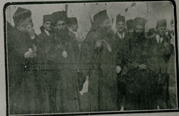
استقبال انطباعلر : پایا اقبامه شاکم باشی ، روم وارسی بطریق قائدهاملری