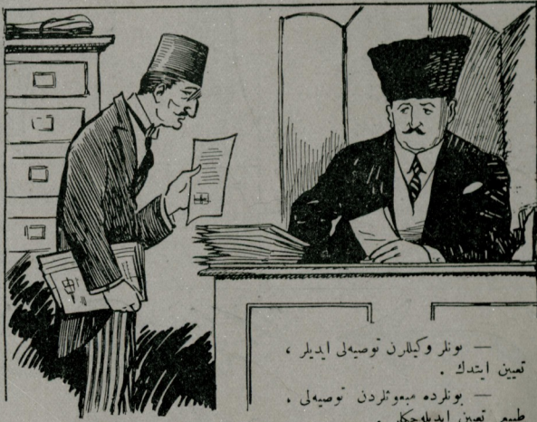
— بونلر وکیلر ن توصیه ایډیلر ، تعیین ایډنک . — بونلر ده میمونلر ن توصیه ای . طبیعی تعیین ایډیله کچر .

سپوردن واز یکدک بر نسمن قوجه یاز کلیر کچرده بردنه اولور سزک اطرافنی چورمن دکره آیانمزی بیه صوقازیز .. و اکثریم صحت و امانیجه دن زیاده بر تحفظ چاره سی اولان بوزمیزی بیله یز .. بوسنه دکز سپورلی نامه کنبلر ن آرا - سنده غزته ره عکس ایډن موفقیتلی بر قاج