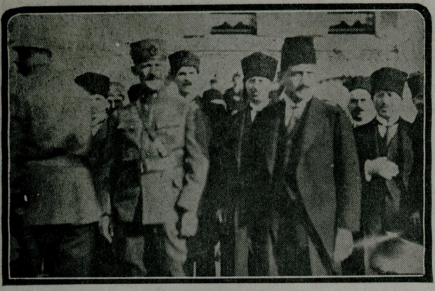
شکری نالی پاشا هیئت میموره آراستده