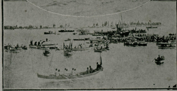
اوسته کی رسم : آتی چیفته سفش حریره فوطه لری یاریش باشلارکن : اوکده کی ایکنجی کن ( یاووز ) دریدتولونک آرقده کده یاریشک برعینه افراد جدیده مکتبیک فوطه لری . آلتده کی رسم : یاریشک محله فرودن بر نظر : یاریشه اشتراک ایډن صدل و فوطه لره مکم هیئتنه مخصوص ( غلظه ) باغی