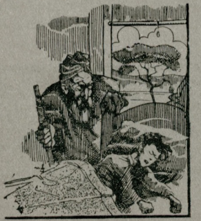
صباحین، اوک آجیق قانان قیوستندن...

دوتور! بو جوجوغی قورتار. قورتار! دیور، هب بوجله بی تکرارلا یوردی. یوقوشک سوکسندمه، بوکسندمه، صابر ماشیقر آراسنه کیرلش، کوچوک، بیاش بر اوه کیدرلر. بوتون اوده هیچ سس یوقدی. ضابط آندمه بر کوچوک لامباهله دوتوری اک اوست قانه چیقاردی ویسبط، بیچلی، تمیز دوشتمش بر یاقاق اوداسنه سوردی. چو جوغ، بو یوک بر جوجوز قار بولاده یایور، چو کس صاری بوزینک او بوقلرندمه ایکی ماوی لکبه بکنزه بن فرسز کوزلرله کلنله باقیوردی.