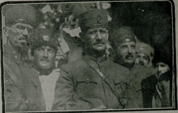
قوماندان شکری نالی پاشا وقول اردو ارکان