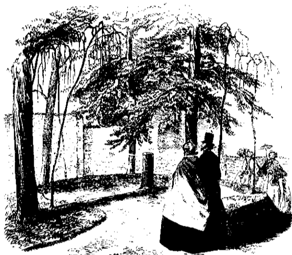
Hamlets Grav i Marienlysts Slotshave.

med Skove og Fjelde saa ijernt tilbage, at kun Nordpolens Stjerner vide, hvor det ender.