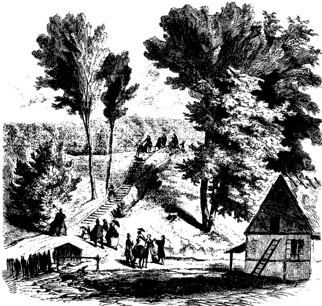
Opgang til Brinken paa Veien til Hammermøllen.