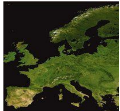
插图 25 这张欧洲地理环境的卫星照片很详细的显示了山脉、半岛、岛屿以及干旱与寒冷的地区

歐洲的地形樣貌頗為豐富。不列顛群島及愛爾蘭島是平原、丘陵與高地混雜的地形，在西歐法國、荷蘭、比利時部分以平原為主，其中荷蘭有許多低窪地區是填海造陸而成。法國與西班牙、安道爾以庇里牛斯山山脈為界，南歐的伊比利半島多丘陵地，各丘陵間則有平原，義大利半島亦以丘陵地為主，穿插許多小面積平原，巴爾幹半島則較多山地。阿爾卑斯山山脈橫互歐洲中部，也就是德國南部、瑞士、捷克、斯洛伐克及義大利北部；德國北部則為平原地形。東歐是一望無際的大草原地形，歐洲的東南界為高加索山脈，其主峰鄂爾布魯士山海拔 5642 米，是歐洲最高峰。北歐則