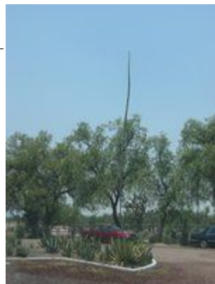
插图 77 野生的龍舌蘭草與細長的花莖

除了品種外，龍舌蘭草的品質往往也取決於它的大小，長得越大的龍舌蘭價格就越好。位於鐵奇拉鎮外死火山口邊坡上的龍舌蘭田裡面種植的作物，一般被認為是品