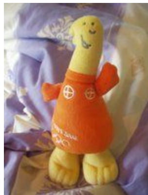
插图 22 2004 夏季奥运会吉祥物：雅典娜的绒布玩具

本届奥运会的另一个重要的问题是反兴奋剂。本届奥运会首次进行针对人类增长荷尔蒙 (HGH) 这类兴奋剂的测试。而希腊两位运动员因故没有药检也引起了不小的风波。