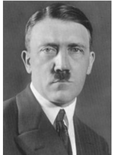
插图 1 阿道夫·希特勒

战争结束后德国废除了君主政体，一个新的魏玛共和国宣告成立。在经历了短暂的繁荣后，魏玛共和国在 1929 年的全球金融危机中遭到重创，面临着严重的经济问题。这为德国极端右翼的兴起提供了良机。由阿道夫·希特勒（Adolf Hitler）所领导的纳粹党就是其中之一，他宣称德国的困境之根源来自于战后强加给德国的严厉条款、懦弱的魏玛共和国以及被指称握有国家经济命脉的犹太人。他的理论受到越来越多德国人的支持，到 1933 年时纳粹党已经从一个微不足道的小党一跃成为国会内第一大党。1933 年 1 月 30 日，魏玛共和国年迈的总统保罗·冯·兴登堡元帅