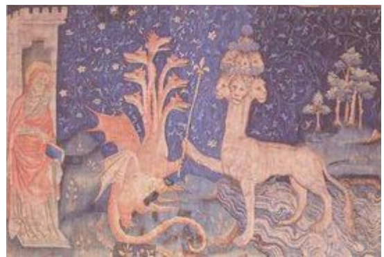
插图 19 昂热尔堡《启示录》壁毯局部(Apocalypse d'Angers)

《圣经》中的七头红龙乃撒旦化身。《圣经·启示录》第十二章这样写道：“天上又现出异象来。有一条大红龙，七头十角，七头上戴着七个冠冕。……大龙就是那古蛇，名叫魔鬼，又叫撒但，是迷惑普天下的。他被摔在地上，他的使者也一同被摔下去。”（And there appeared another wonder in heaven; and behold a great red dragon, having seven heads and ten horns, and seven crowns upon his heads... And the great dragon was cast out, that old serpent, called the Devil, and Satan, which deceiveth the whole world: he was cast out into the earth, and his angels were cast out with him.）