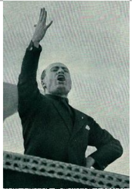
插图3 本尼托·墨索里尼意大利领袖 意大利法西斯主义的创立人

1944年8月15日盟军又发动“骑兵行动”（Operation Dragoon），从法国南部发起攻击。到9月，三组盟军部队已经抵达德国边境，很多乐观估计认为战争在1944