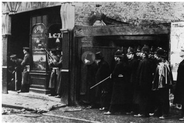
插图 6 丘吉尔被拍到在塞德奈街杀戮事件现场的照片，圆圈中的人就是丘吉尔

1910年丘吉尔出任内政大臣，虽然他在监狱改革等方面做出了贡献，但是由于当面对工人游行罢工时采取的毫无手软的态度而遭到指责，他在任内曾经多次下令军警镇压罢工和游行活动。他最著名的一次行动是发生在1911年1月的“塞德奈街杀戮事件”，当警方得知有一伙东欧无政府主义者抢劫了一家珠宝店后，丘吉尔亲自到达现场指挥包围行动，调动了大炮、军队。一名摄影记者排下了丘吉尔在现场的照片，事件被大肆渲染，保守党领袖阿瑟·巴儿弗嘲讽丘吉尔道：“他[丘吉尔]和那名摄影师都将自己宝贵的生命置之不顾。我知道这位摄影师正在干什么，但这位可敬的绅士又在干什么？”