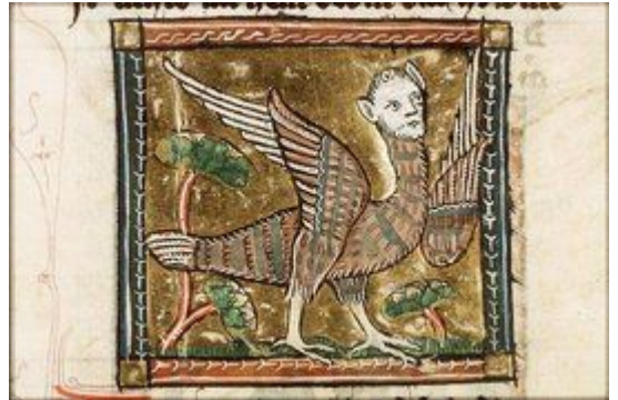
插图 14《自然之花》插图雅戈布·凡·马尔兰作