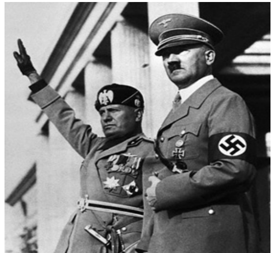
插图 2 墨索里尼与希特勒在一起

在几个自由政府无法解决这些威胁后，国王维克多·爱麦虞埃三世（King Victor Emmanuel III）在 1922 年 10 月 30 日邀请右翼政客本尼托·墨索里尼（Benito Mussolini）以及他所领导的法西斯党组成政府。法西斯党人上台后依然保留自己的非正规武装，用以打击无政府主义者、共产党人和社会主义者。