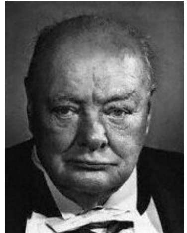
插图 9 晚年的丘吉尔

战争结束后，战时内阁也必须解散。5月23日丘吉尔辞职，并将大选定于7月5日举行。原本信心满满、认为凭借丘吉尔在战争中的功劳定能顺利当选的保守党，却在大选中惨败，丘吉尔本人虽然当选议员，但是保守党只获得了197席，而工党却赢得393席，得以组阁，工党领袖克莱门特·艾德礼当选首相。这主要是因为工党提出的建设福利国家的目标对战后一贫如洗的英国社会有着极大的吸引力。带领英国人民走向胜利的丘吉尔却被抛弃了，他后来引用古希腊作家普鲁塔克的话说：“对他们的伟大人物忘恩负义，是伟大民族的标志。”7月26日，丘吉尔正式卸下了首相职务。