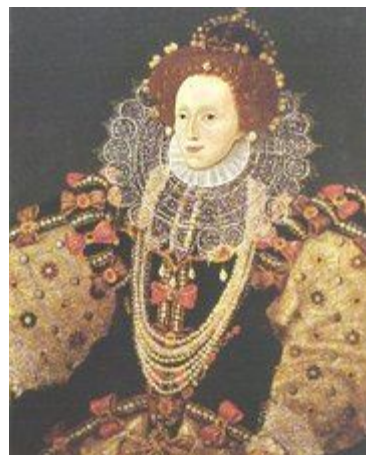
插图 20 成年的伊丽莎白一世

伊丽莎白一世 (Elizabeth I, 1533年9月7日出生于格林尼治，即今日伦敦的格林尼治，1603年3月24日逝世于萨里)，是英格兰女王，在位时间是1559年11月17日至1603年3月24日。她是都铎王朝的最后一位国王。她有时也被称为“处女女王”。她统治时英格兰内部因宗教分裂。但她不但成功地保持了英格兰的统一，而且她的统治时期是英格兰强壮和国家建立最重要的一个时期。在她的统治期内英格兰文化达到了一个顶峰，通过羊毛交易国家经济也得到了很大的发展。她的统治期在英国历史上被称为“伊丽莎白时期”。