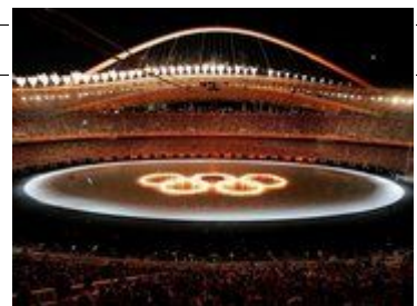
插图 238月13日，2004夏季奥运会开幕式以游泳池的水里生起燃烧的奥林匹克环为开端。

在开幕式各国代表团进场时，韩国与朝鲜队被安排在一起出场，以表现两国人民之间的感情。