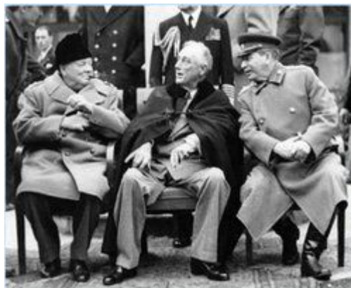
插图 8 丘吉尔、罗斯福和斯大林在雅尔塔会议上的合照

战争中丘吉尔与斯大林的关系是十分特殊的。丘吉尔是著名的反共分子，但是在二战中却愿意与斯大林合作对抗纳粹德国。1942年8月丘吉尔亲自访问莫斯科，向斯大林保证盟军很快就会在欧洲大陆开辟第二战场，减轻苏联独自面对德军的压力。1944年6月6日，在又拖延了两年后，盟军的诺曼底登陆行动终于开始，斯大林向丘吉尔表示祝贺，称这次行动在“战争史从来没有过足以与之类比的事