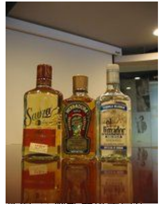
插图 10 幾款等級不同的 Tequila

Mezcal ——Mezcal 其實可說是所有以龍舌蘭草心為原料，所製造出的蒸餾酒之總稱，簡單說來 Tequila 可說是 Mezcal 的一種，但並不是所有的 Mezcal 都能稱作 Tequila。開始時，無論是製造地點、原料或作法上，Mezcal 都較 Tequila 的範圍來得廣泛、規定不嚴謹，但近年來 Mezcal 也漸漸有了較為確定的產品規範以便能爭取到較高的認同地位，與 Tequila 分庭抗禮。