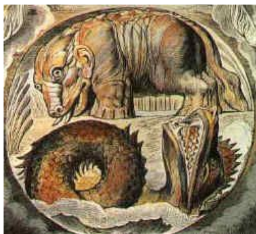
插图 15 巨兽与海魔《约伯记》插图，威廉·布莱克作

比蒙巨兽（Behemoth，也译作巨兽）是西方的神话生物。在希伯来文中称 בהמות（Behemot/B'hemot），意为“群兽”，暗指它形体庞大，群兽相合才能与其并论。关于它的样貌，《圣经》中记载最为详尽：“你且观看河马。我造你也造它。它吃草与牛一样。它的气力在腰间，能力在肚腹的筋上。它摇动尾巴如香柏树。它大腿的筋互相联络。它的骨头好像铜管。它的肢体仿佛铁棍。它在神所造的物中为首。创造它的给它刀剑。诸山给它出食物，也是百兽游玩之处。它伏在莲叶之下，卧在芦苇隐密处和水洼子里。莲叶的阴凉遮蔽它。溪旁的柳树环绕它。河水泛滥，它不发战。就是约旦河的水涨到它口边，也是安然。在它防备的时候，谁能捉拿它。谁能牢笼它穿它的鼻子呢。”（《圣经·约伯记》第四十章）除了尾巴如香柏树，这一描绘与河马都较符合，因而和合本的译者就直接以“河马”指称比蒙。但关于它的原型，也有人说大象，说水牛，说鳄鱼，说恐龙，莫衷一是。在威廉·布莱克所绘的《约伯记》插图中，比蒙状似河马，生就獠牙，人耳狮尾。