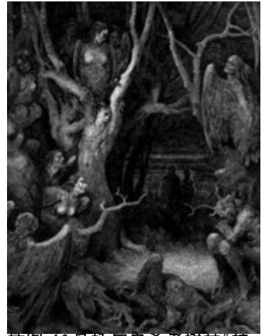
插图 13 鸟妖与自杀者树林《神曲》插图古斯塔夫·多雷作

据传鸟妖总是饕餮贪婪，永远不知饱足。古希腊人认为这来自众神的诅咒。因而鸟妖的母题往往与食物有关。比如维吉尔的《伊尼亚德》中，鸟妖在斯托法岛弄脏了特洛伊人的食物，遭到反击，死了几个同伴。于是领袖“黑暗”预言：灾祸将降临特洛伊人头上，他们还会遇到饥荒。瓦勒里乌斯·弗拉库斯的《阿尔戈船英雄记》讲述了另一个关于鸟妖的神话，其中也提及食物：色雷斯国王腓尼斯能预知未来。宙斯因他泄露天机神旨，将其流放荒岛。岛上吃食富有，可每当腓尼斯要进餐，鸟妖就会飞来，夺走桌上美味。后来伊阿宋与阿尔戈船英雄来到岛上。腓尼斯求他们赶走妖孽，许以指点前程为报。于是英雄们派出北风神的两个儿子伽莱和兹特。这对兄弟肋生双翼，将鸟妖一直赶到斯托法老巢。亏得彩虹女神出面，保证再不侵扰国王，她们方才逃过一死。(彩虹女神也是伊莱伽与陶马斯所生，因而与鸟妖份属姐妹。)