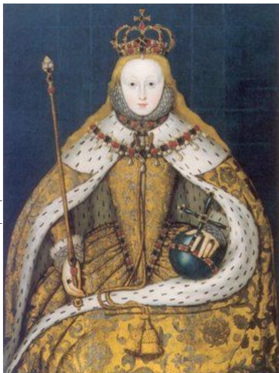
插图 21 在姊玛丽一世死后，伊丽莎白加冕于1559年

伊丽莎白44年的统治期间英国宗教分歧的斗争非常强烈。1530年代里亨利八世与天主教决裂，圣公会建立。爱德华六世的短暂统治期间圣公会的教义日益完善。玛丽统治期间圣公会失去了其统治地位。伊丽莎白恢复了圣公会的地位。在伊丽莎白统治的最初两年间她就发布了至尊法和单一法令，规定国王同时是教会的最高领导人。