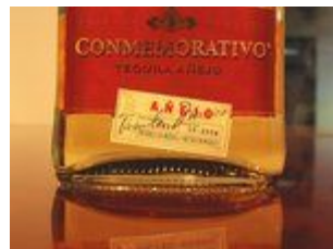
插图 12Añejo 等級的陳年龍舌蘭酒認證標籤

Añejo 在西班牙文裡面原意是指「陳年過的」，簡單來說，就是橡木桶陳放的時間超過一年以上的酒，都屬於此等級，沒有上限。不過有別於之前三種等級，陳年龍舌蘭酒受到政府的管制可是嚴格許多，它們必須使用容量不超過 350 公升的橡木桶封存，由政府官員上封條，雖然規定上只要超過一年的都可稱為 Añejo，但有少數非常稀有的高價產品。例如 Tequila Herradura 著名的頂級酒款