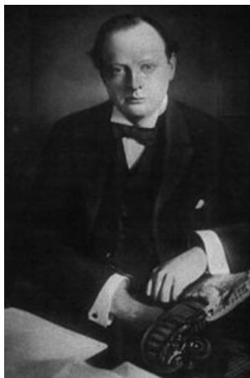
插图7 青年时代的丘吉尔

1929年5月英国再度举行大选，这次选举中丘吉尔本人虽然险胜，但是在全国，保守党和自由党惨败，麦克唐纳的工党政府重新执政。这段后来被称为“在野岁月”的日子是丘吉尔政治生涯中的最低潮，他在议会中除了批评政府提出的印度自治方案，并决定与国大党谈判外，大部分时间用于写作，包括已经在连载中的《世界危机》以及《我的早年生活》，还有一本关于祖先马尔巴罗公爵一世的传记。此外他