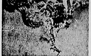
پایه در مومضات و در پای زمین کارکنان اول کمال ایران انقلاب در دوران و دوم رساندن پیام انقلاب

مبارزه کنیم ولی که در استقبال خطر بشاییم . بهنگد با مردمی کویت بود ، اینها را پیروزی قامت پیدآوریم تاریخ مسلمان را ، جنگ بدر را ۲۳۲ در مقابل انقلاب تاریخ تقریبا هزار نفر ، گرچه تعداد نفرات مطرح نیست این ایمان خود بهماست که همیشه پیروز است . این شوق و اشتیاق است که با وجود دشمنان و دشمنان خود هدایت شود می تواند در مقابل دشمنین محاصره های اقتصادی ایستادگی کند .