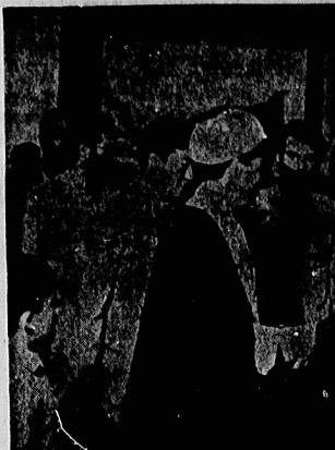
پایه در مومضات و در پای زمین کارکنان اول کمال ایران انقلاب در دوران و دوم رساندن پیام انقلاب