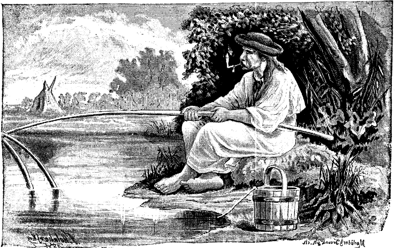
Pescariul dela Tisa.

Dar din o cupă iute se făcură doue și așa mai departe. Studenții aveau voie, ceialalți óspeți asemenea.