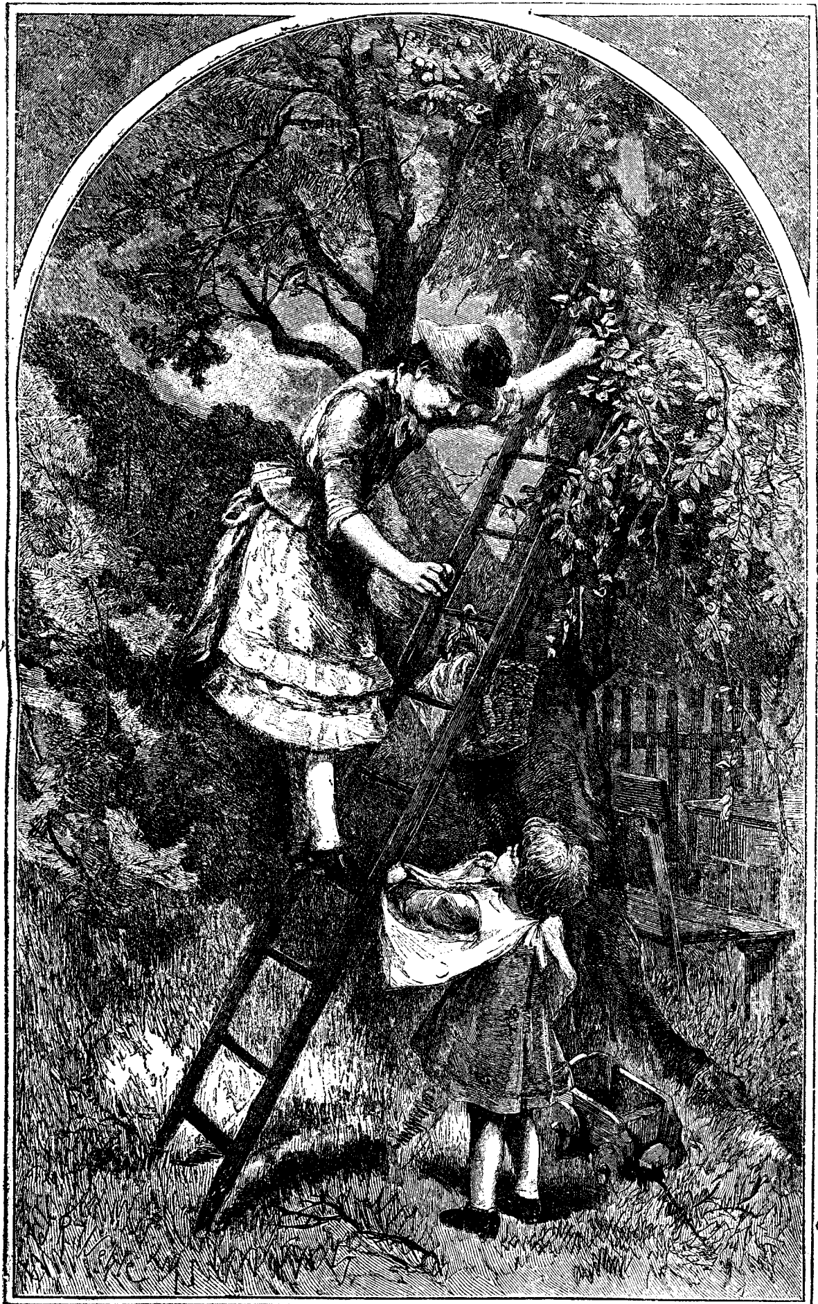
T Ó M N A.