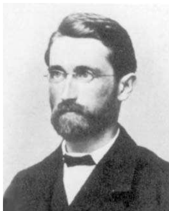
Richard Dedekind (1831-1916)

BEMERKUNG 48.4. Die Mengen A bzw. B heißen auch die Untermenge bzw. Obermenge des Dedekindschen Schnittes. Sie legen sich wegen der Bedingung (2) gegenseitig fest. Jede reelle Zahl z \in \mathbb{R} (und auch jedes Element in einem angeordneten Körper) definiert einen Dedekindschen Schnitt, indem man