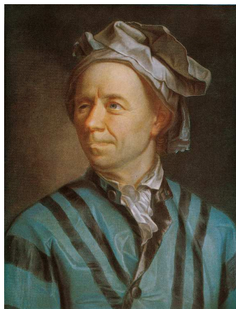
Leonhard Euler (1707-1783)

und konvergieren somit gegen 0. Also liegt insgesamt eine Intervallschachtelung vor. \square