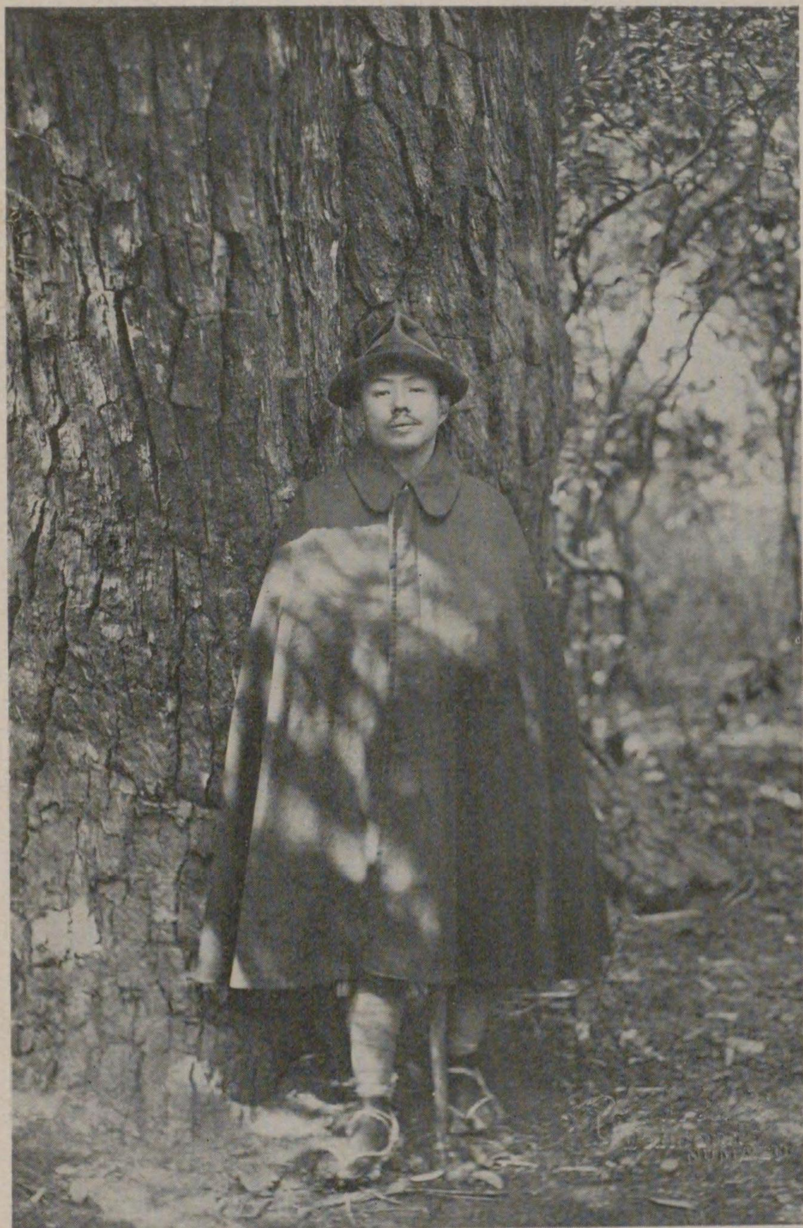
千本松原にて（昭和三年五月）