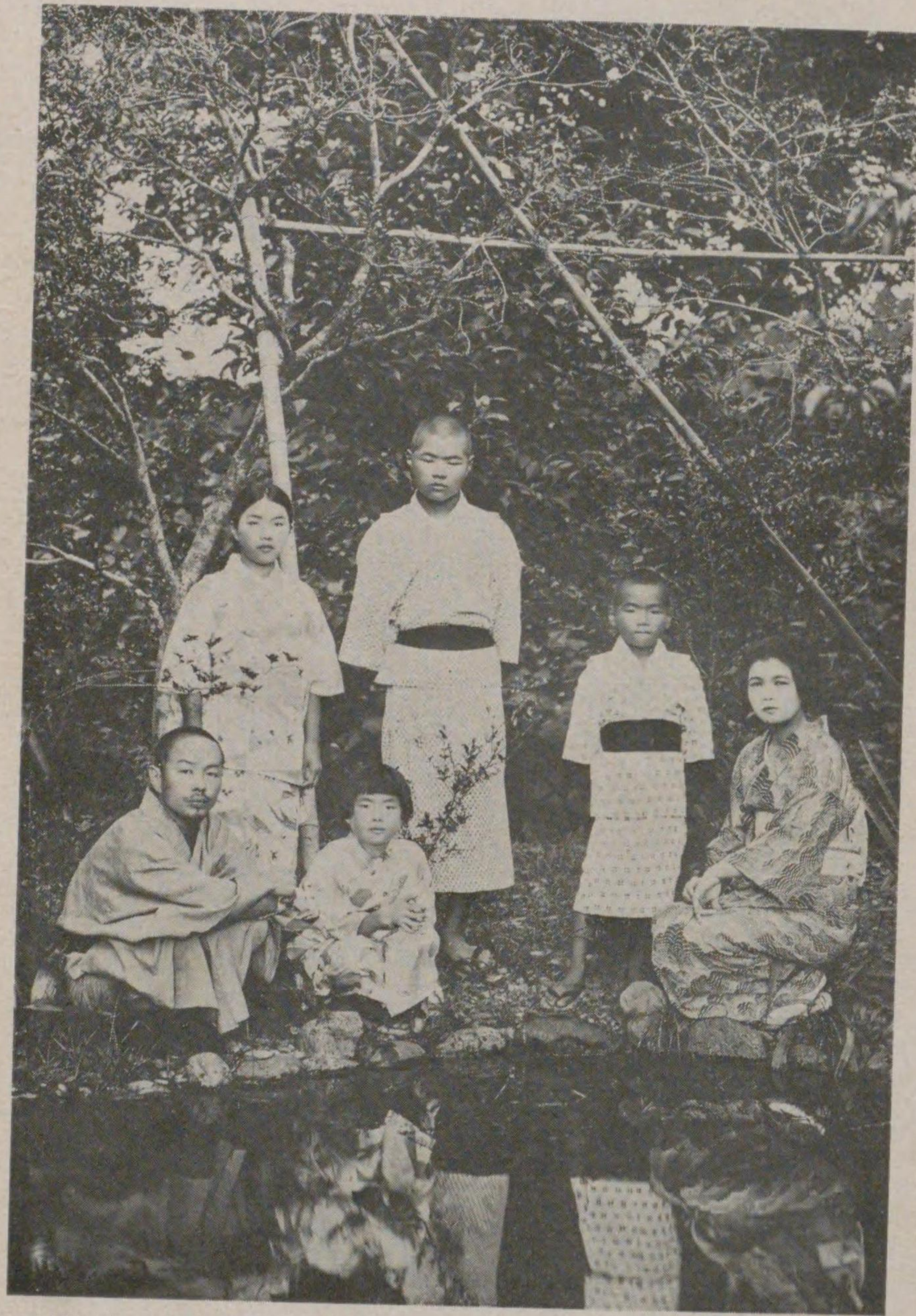
(月七年三和昭) 族 家