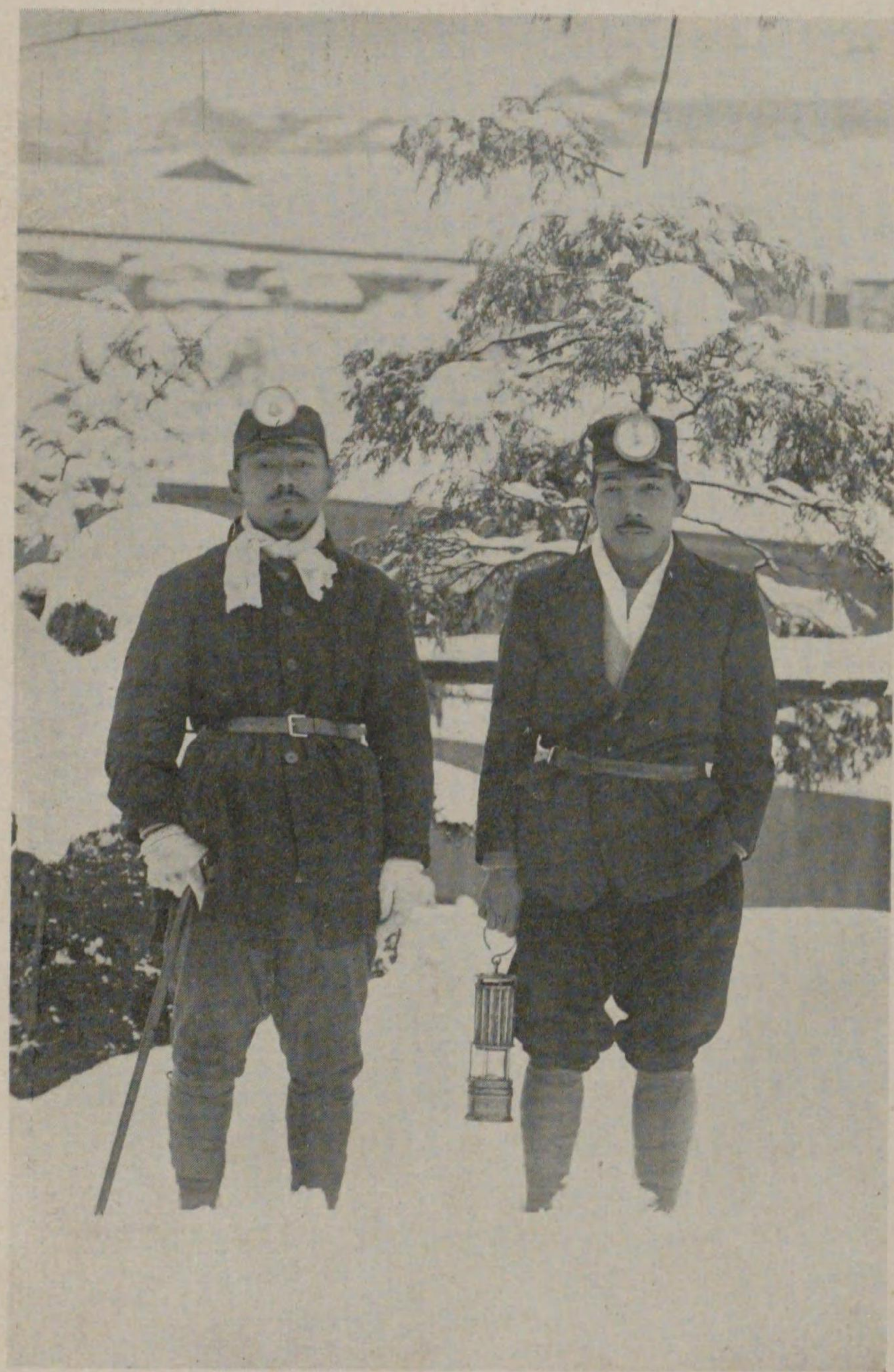
(月一十年五十五正大) てに山炭張夕