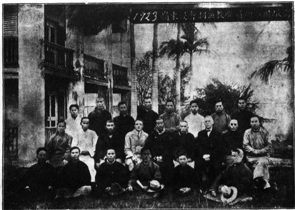
1923 廣東省立第一師範學校教職員合影