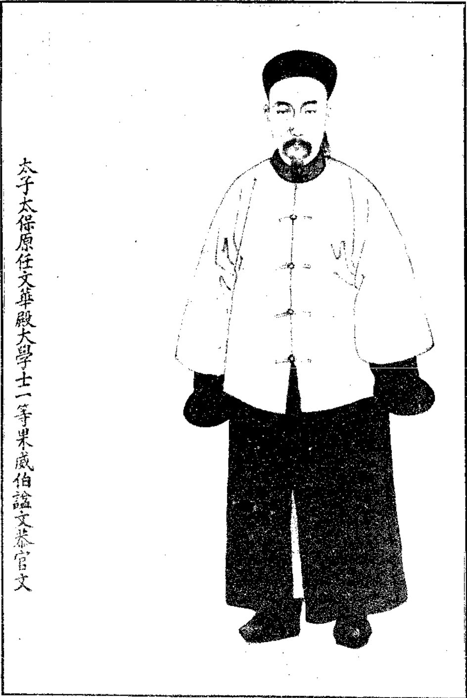
原 件 長 4 7 寬 3 4 C M.