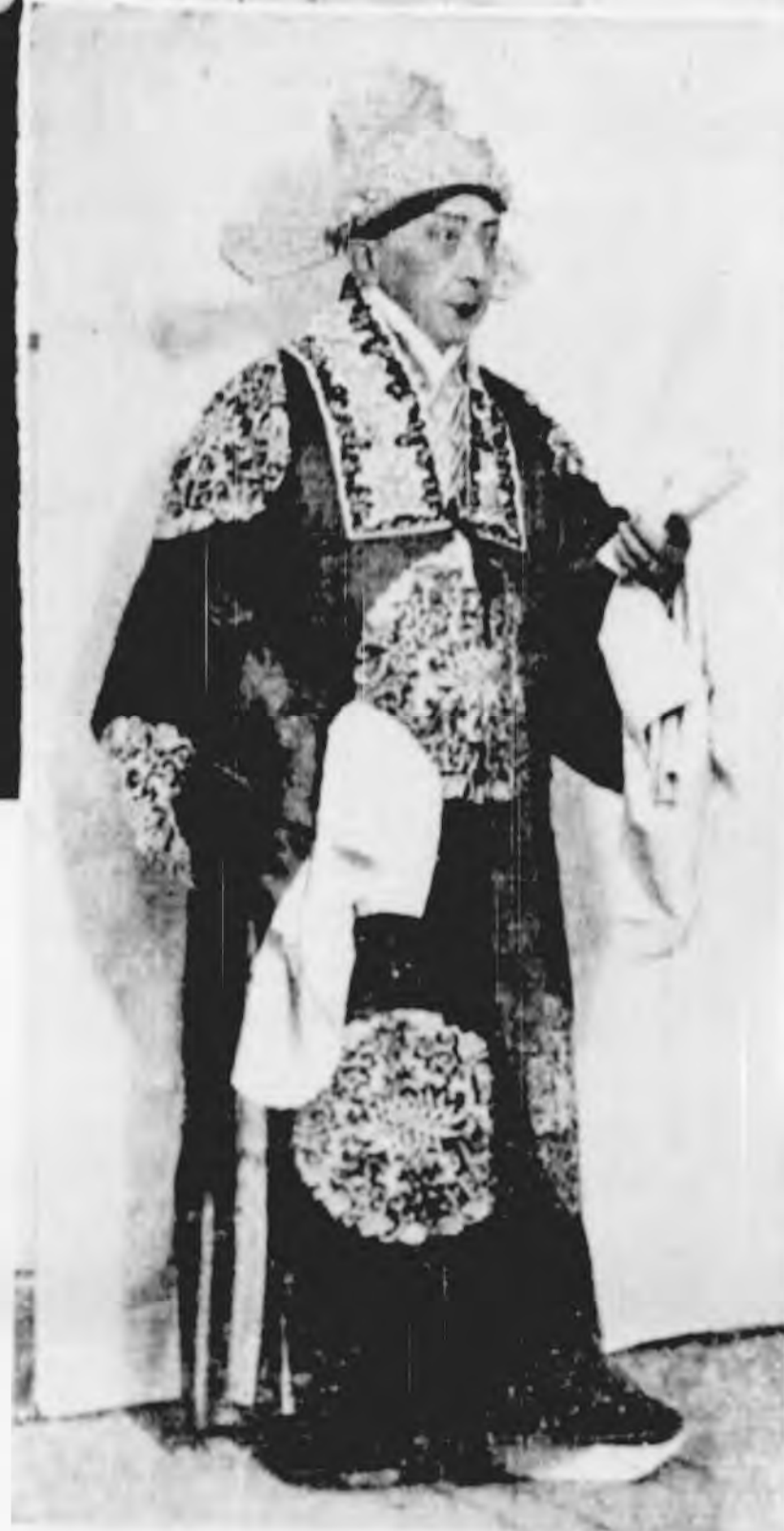
(瑜周) 君平燕關 會英羣