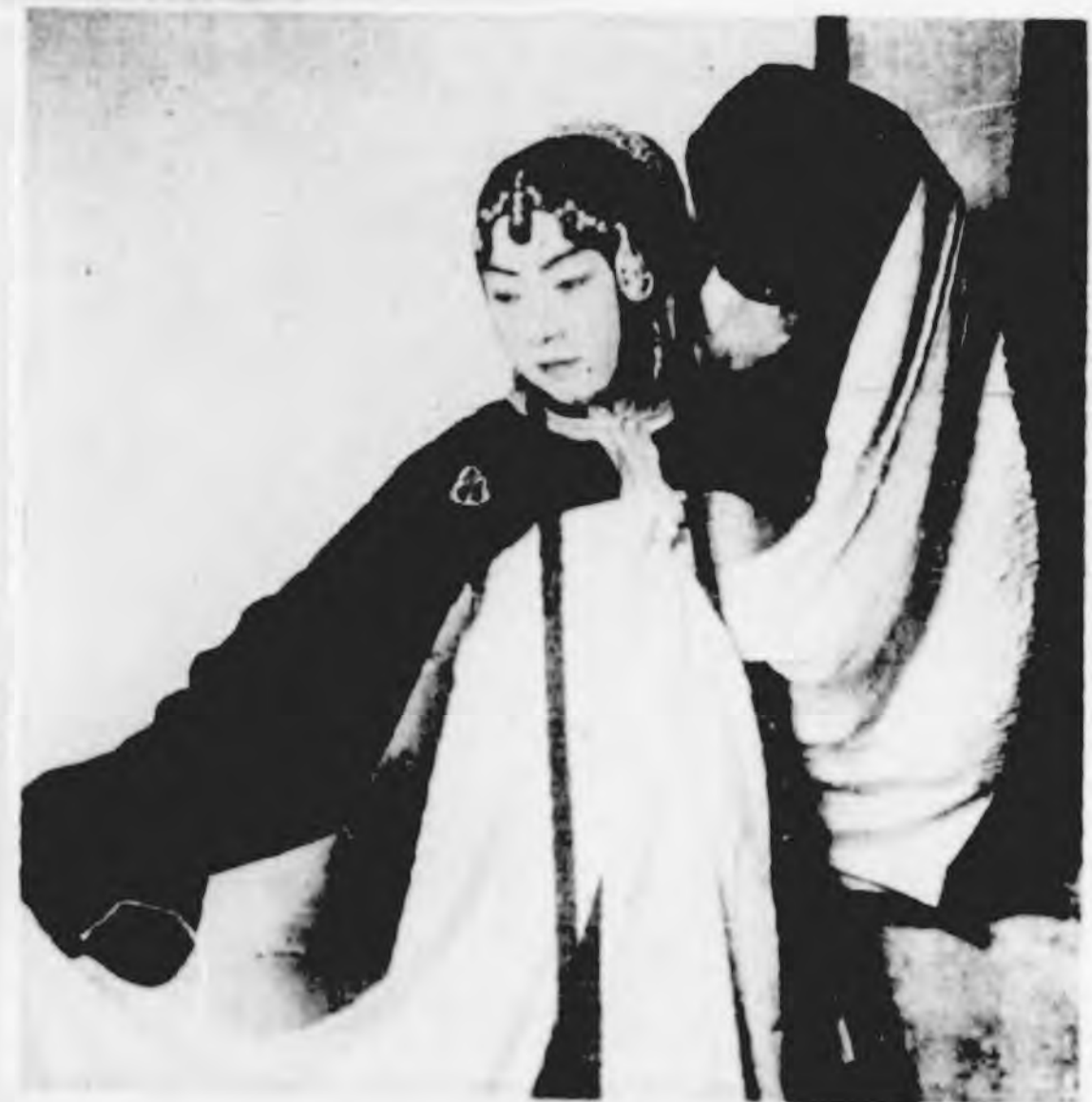
(艷雪) 君生鐵南 湯刺頭審