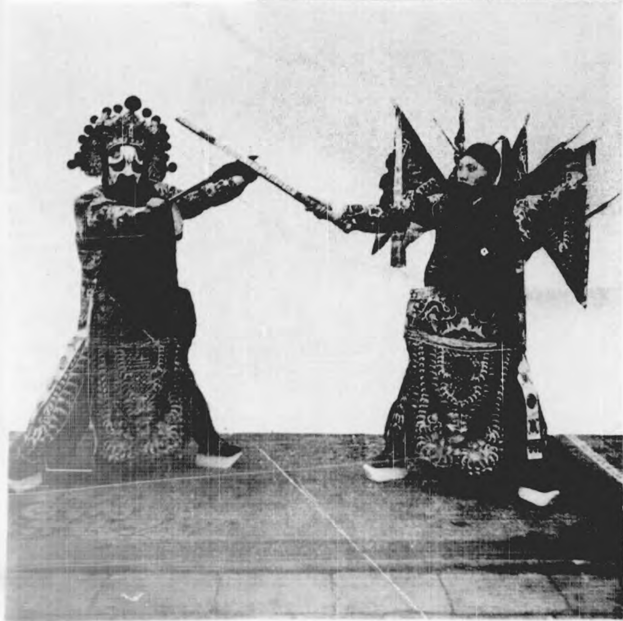
寧武關之 兩個場面