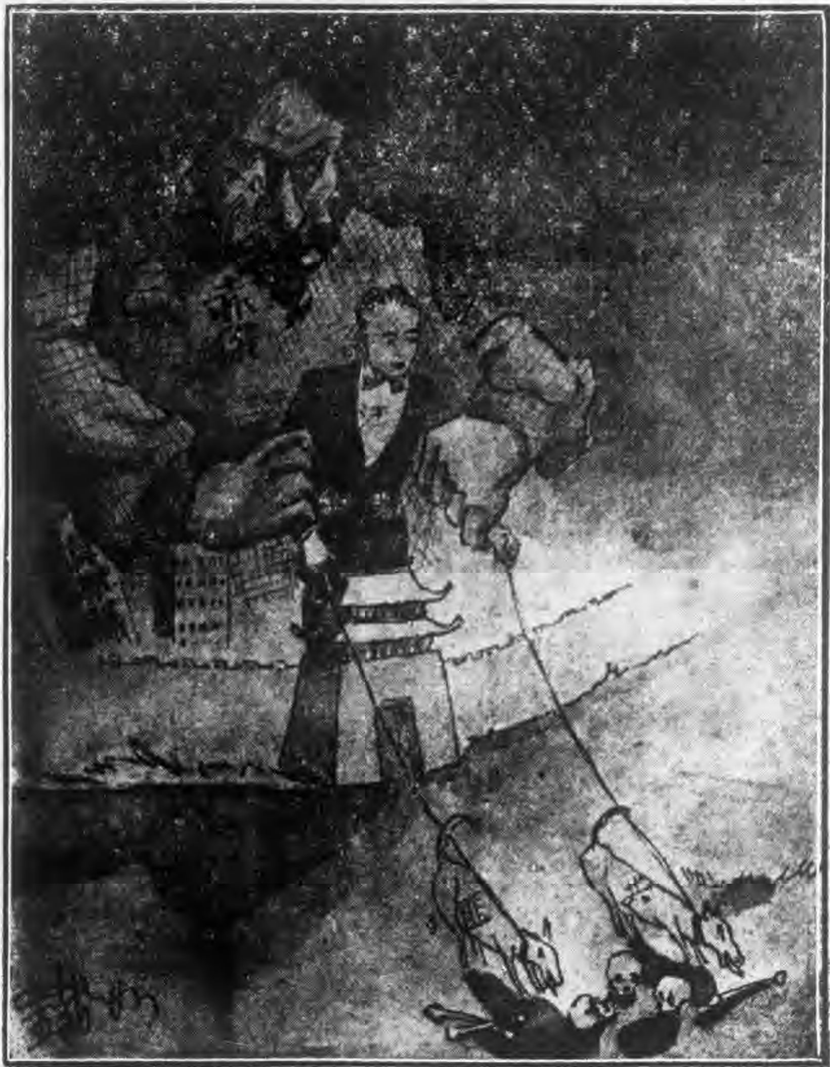
汪逆精衛奉赤俄之使共匪殘害人民