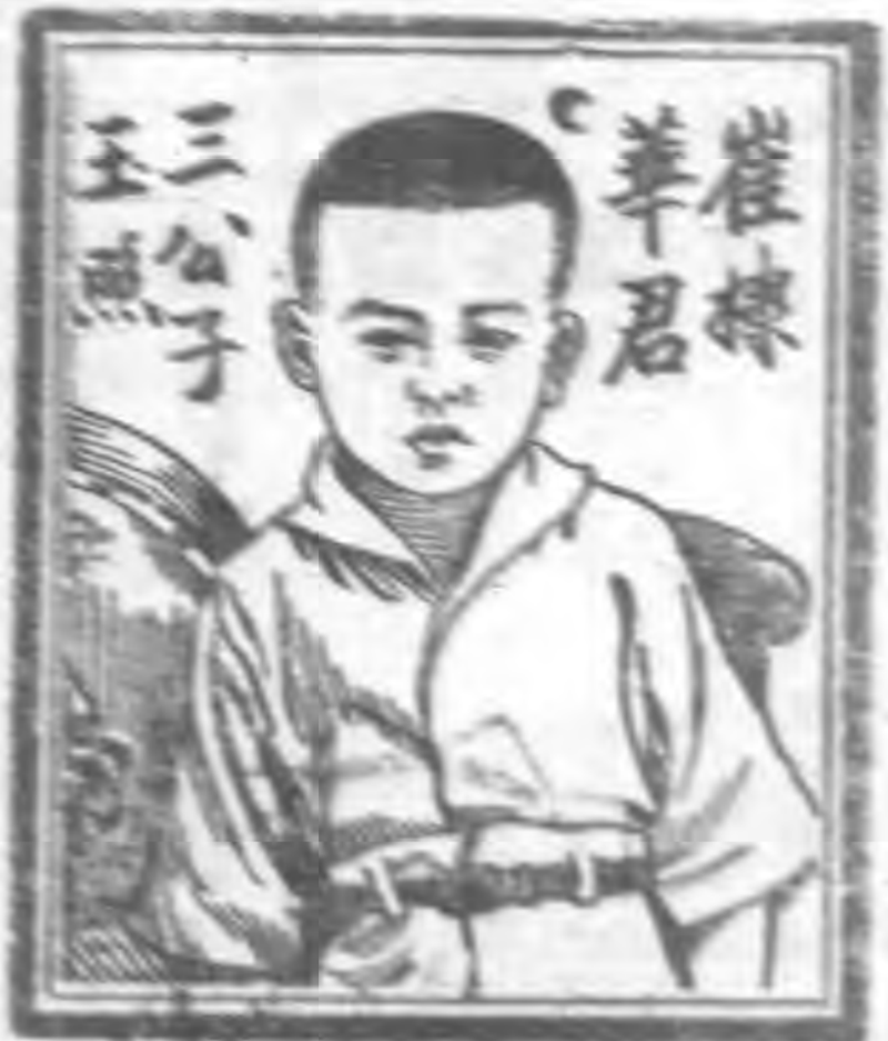
崔君 華君 三公子 王燕山

不料三瓶之後體氣頓佳胃納漸增任勞無苦於是繼續服用該丸以還常任康強愉快中也 各藥局均有出售每瓶一元五角六瓶八元郵費不取 早老或患血虧各症求醫已於廣東士醫生紅血補丸 壯血故也血足而強全體器官均得養壯活潑反之血 血虧則血虛年而弱健已失道矣是故君如自覺 壯血故也血足而強全體器官均得養壯活潑反之血 壯血故也血足而強全體器官均得養壯活潑反之血