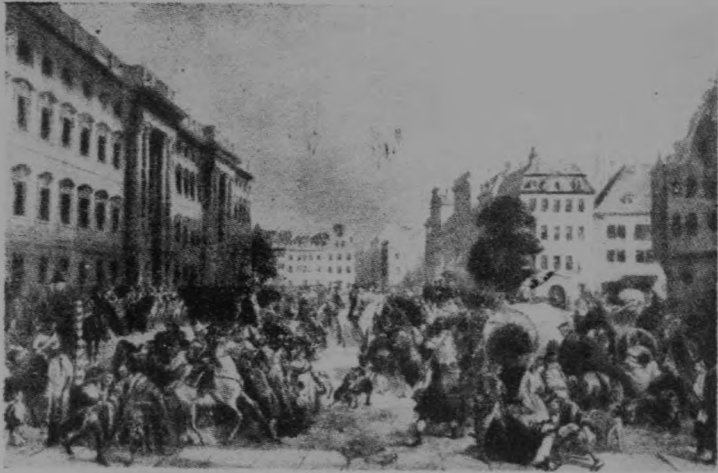
一七六〇年俄軍開 進柏林城 柯欣布繪