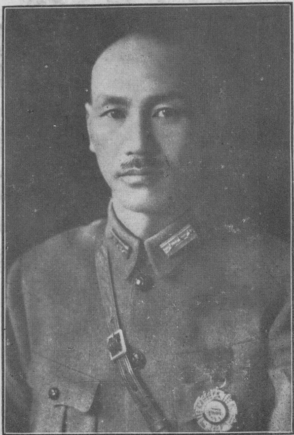
蔣 委 員 長 肖 像