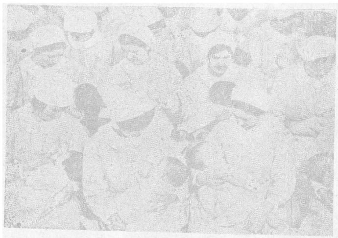
集 團 的 奶 哺 嬰 兒

一九三三年六月二十七日正式報告，在一九三二年十二月三十一日，這樣的機關共有五、九一四所，到一九三三年三月三十一日，增加為七、四二九所。前後僅四個月，增加一千多