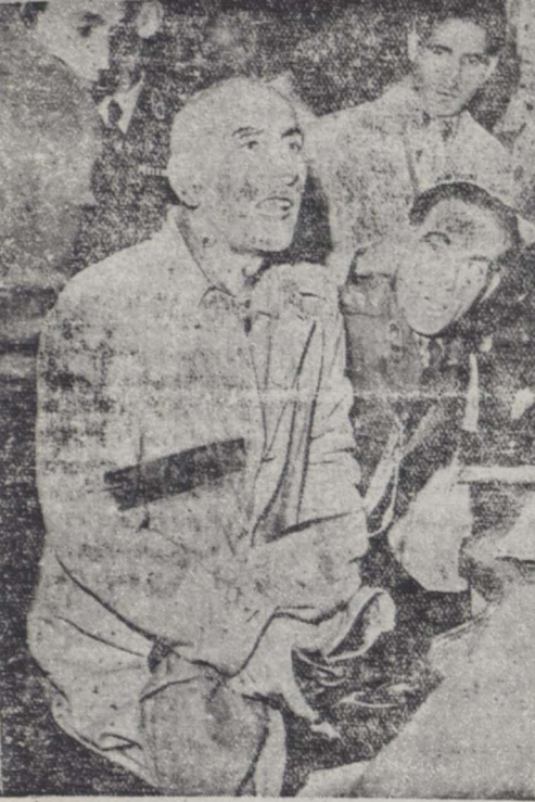
حنکای که رئیس دادگاه اعلام تنفس نمود دکتر مصدق از رئیس اجازه گرفت تا غایب تنفس در دادگاه استراحت کند در این مجلس دکتر مصدق هنگام کسب اجازه از رئیس دادگاه دیده میشود