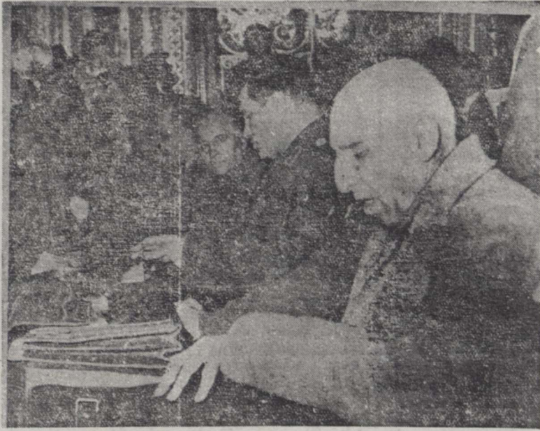
قبل از رسیدن یافتن دادگاه آقای دکتر مصدق اوراق مربوط بدفاع خود را از کیف دستی بیرون میآورد

دنیای امروز مشکلات عبور و مرور را با اتخاذ تصمیمات شدید و بکار بردن مقررات و آیین نامه های بقیه در صحنه هتم