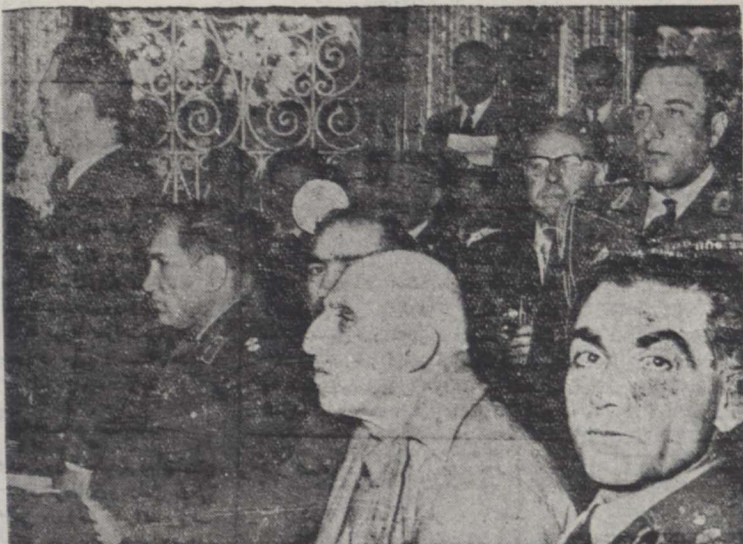
آقای سرهنک بزرگهر و کل مدافع در ترم صدق در معرض دادگاه سبب دست ایشان نشسته است در طرف چپ آقای سرتیپ ریاحی هنگام پاسخ بستوالات رئیس دادگاه دیده میشود

این نیست که سیاست خارجی با اشخاصیکه ضلالت در این جلسه عملیاتی میکنند ارتباط داشته باشد، برای خود من یک واقعه روی داده که ناچار از عرض آن میباشم آن واقعه این بود که در دوره پانزدهم تقنینیه و تیکه انتقالات تهران شروع شده بود یکمده خانه من آمدند و گفتند فریاد بیاید در مسجد شاه و بیاناتی بکنید و مردم را متوجه نماید که انتقالات آزاد است و دولت دخالتی ندارد. من آزاد شدم تهران را برای حضور در مسجد شاه دعوت کردم. در این هنگام رئیس دادگاه گفت متقاضی است دو موضوع ایراد صلاحیت صحبت کنید آقای دکتر مصدق اظهار داشت آقای هم مربوط به همان است کتاب قانون در مرحمت نمایند و در تالی این جمله گفت خیلی خوب است اما ماده ۱۹۹ را بفرمایند قرائت کنند (ماده قرائت شد در ابتدای ماده مزبور جمله ای تا کرده شده بود که آنچه را که برای ما مافه مفید میدانم) آقای دکتر مصدق در تالی این جمله گفت و گفت بلای آنچه را که برای مدافع مفید میدانم بفرمایند آقای گفته شده مفید میدانم (رئیس دادگاه) آقای این ماده مربوط به صلاحیت نیست