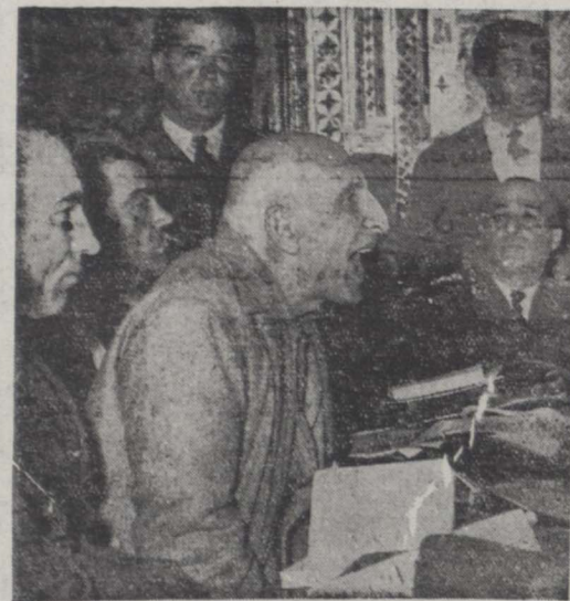
آقای دکتر مصدق هنگامیکه باظهارات دادستان پاسخ میدهد