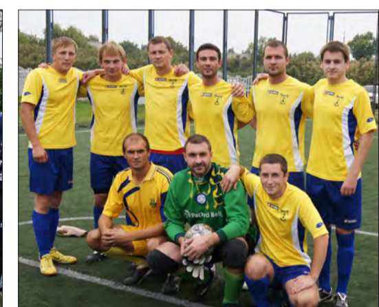
Команда «Комінтерн» (смт Н.Галещина).