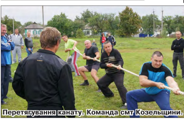
Перетягування канату. Команда смт Козельщини.