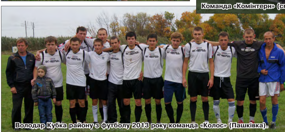
Володар Кубка району з футболу 2013 року команда «Колос» (Пашківка).