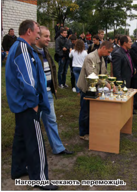
Нагороди чекають переможців.