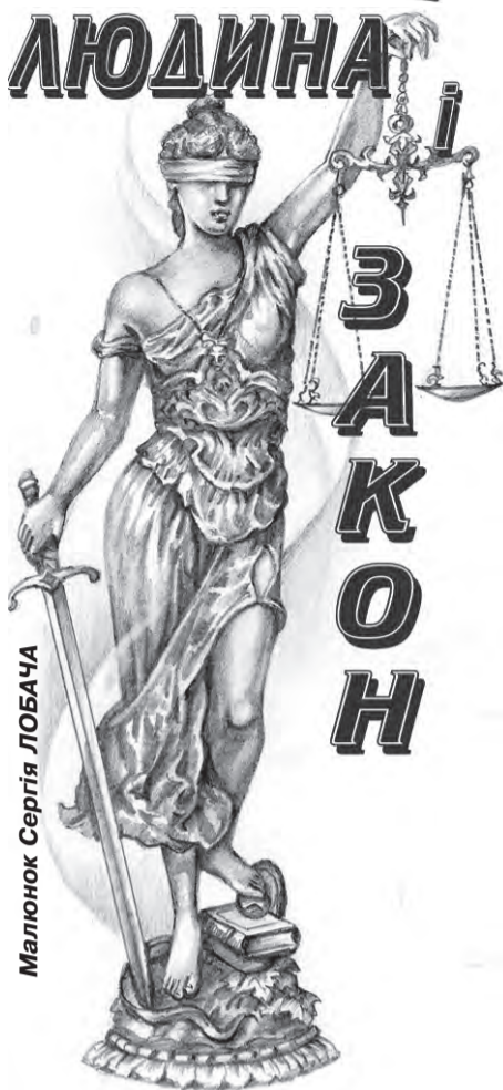
Малюнок Сергія ЛОБАЧА