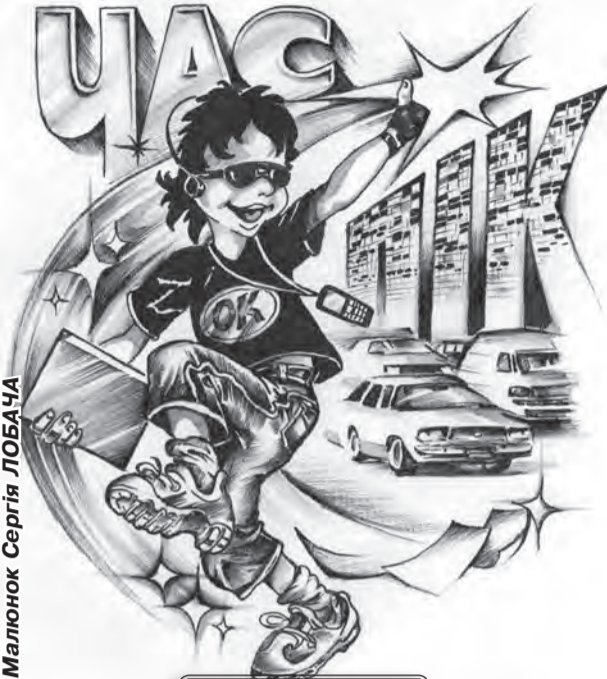
Малюнок Сергія ЛОБАЧА