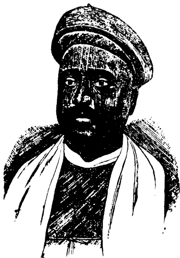
• THE WELL-KNOWN BAL GANGADHAR TILAK.

पर उपकारगामाही । अनिर्वच्यं तस्य मूला पापं गहीं भाष्यं मेरे । पणव दामं नाही किं ।