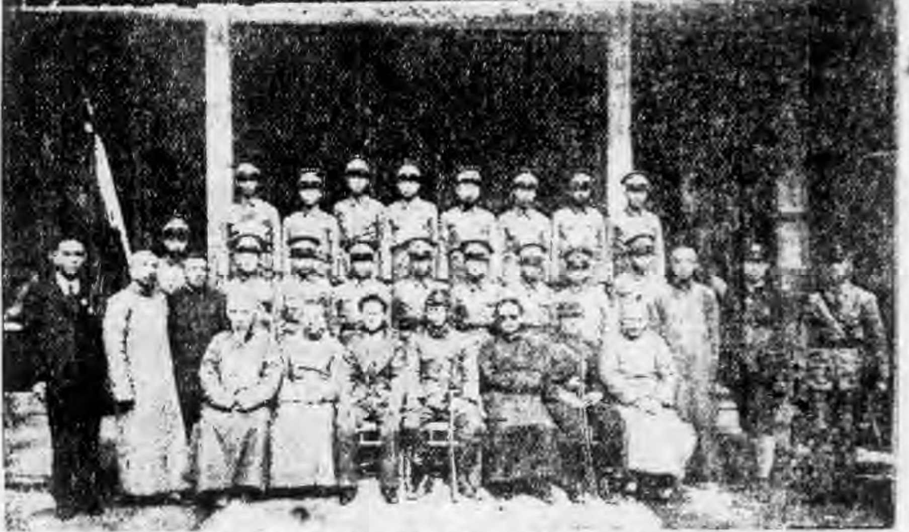
海寧縣斜橋鎮第一團畢業典禮攝影