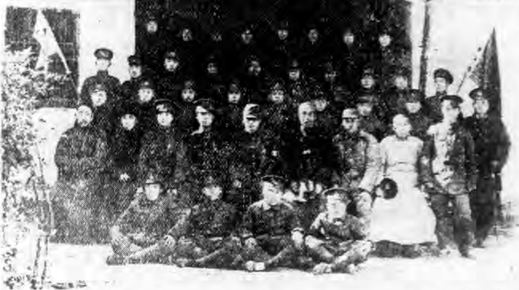
安來縣青年團第一團開訓典禮攝影