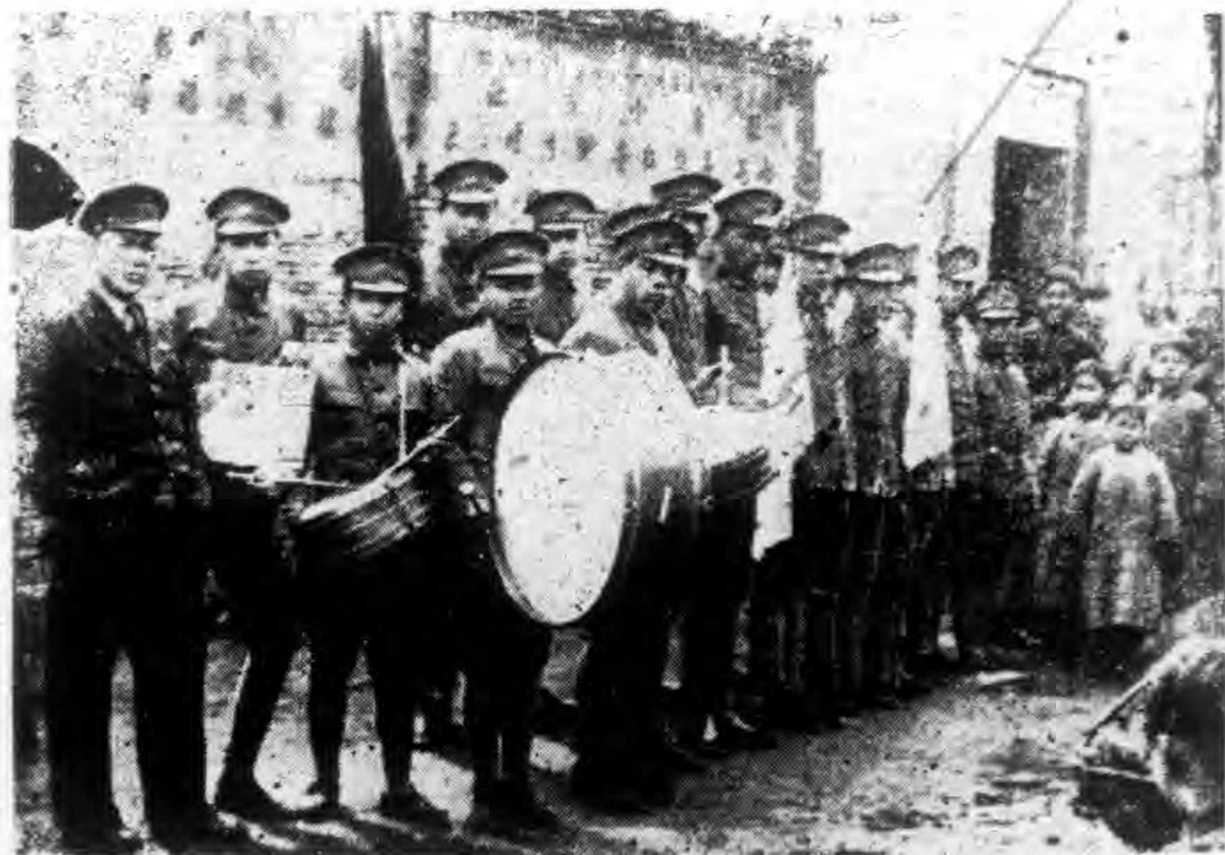
影攝傳宣動運民國新加參員團團年青縣陽丹