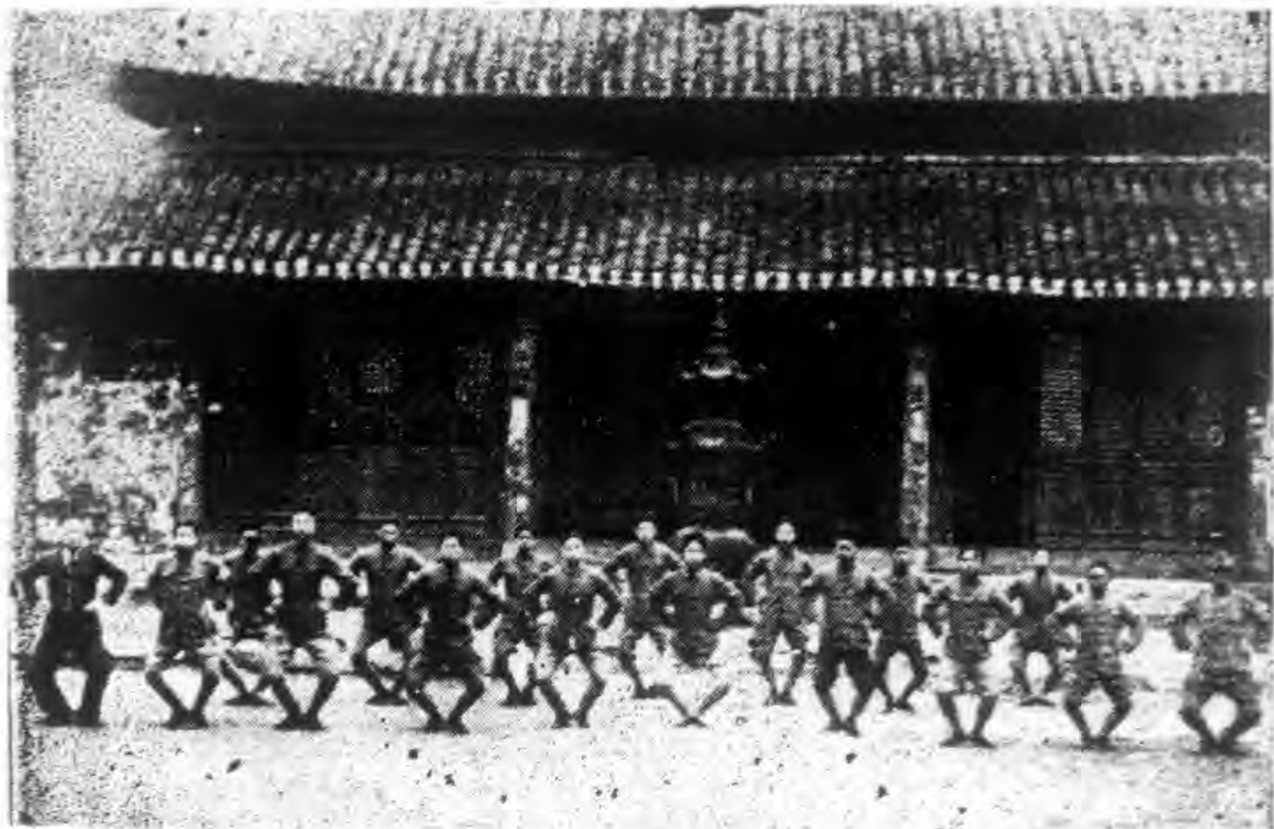
影攝操早員團團年青縣陽丹