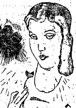
小福特剪影 (上) 柏克