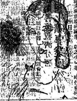
英國人眼中的蘇聯戲劇... 蘇聯戲劇... 蘇聯戲劇...