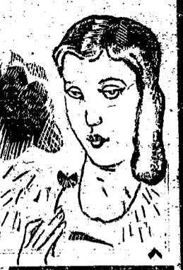
國民公園 期六十四新