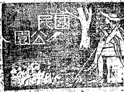
小福特剪影(中)柏克