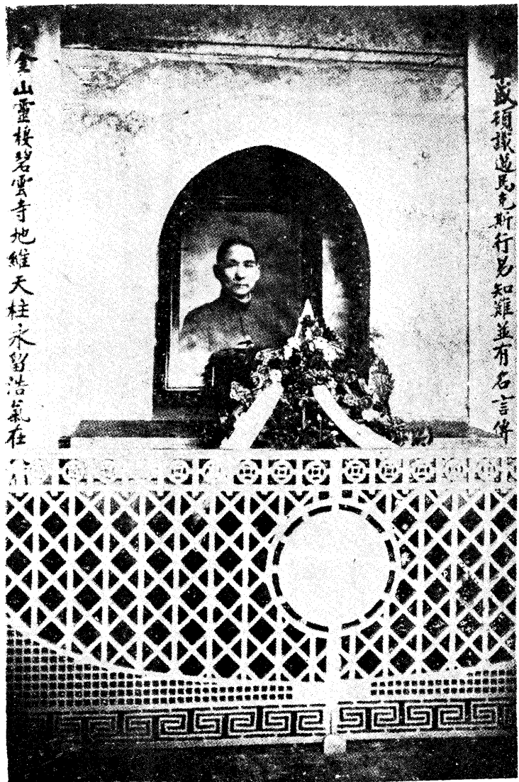
北平西山碧雲寺靈堂