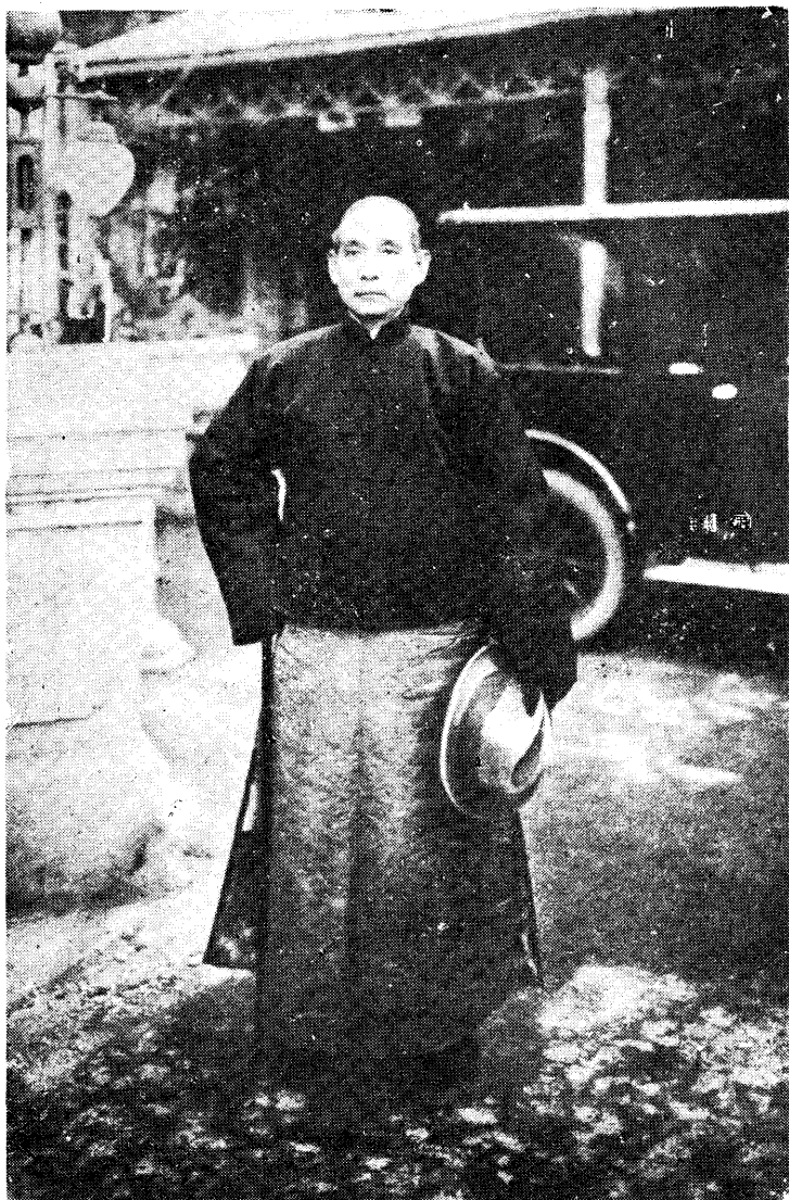
影 攝 時 館 行 津 天 抵 初 日 五 月 二 十 年 三 十 150333