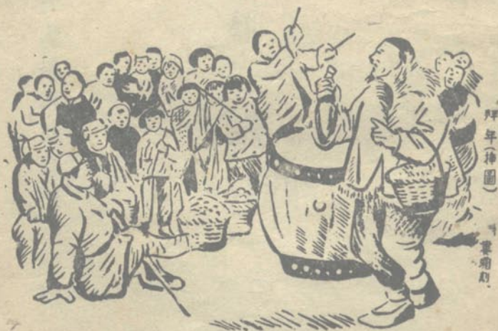
拜年(神圖) 畫者 田間