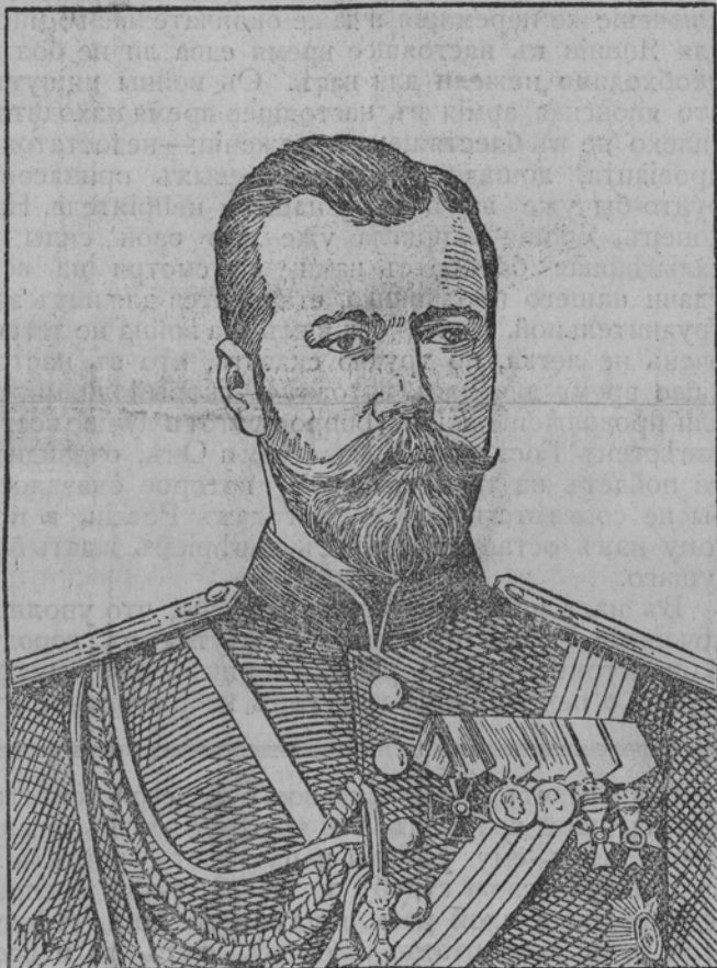
ЕГО ИМПЕРАТОРСКОЕ ВЕЛИЧЕСТВО НИКОЛАЙ ВТОРОЙ ИМПЕРАТОРЪ ВСЕРОССИЙСКІЙ.

Въ числѣ подобныхъ явленій имѣетъ первенствующее значеніе Высочайшій рескриптъ, данный