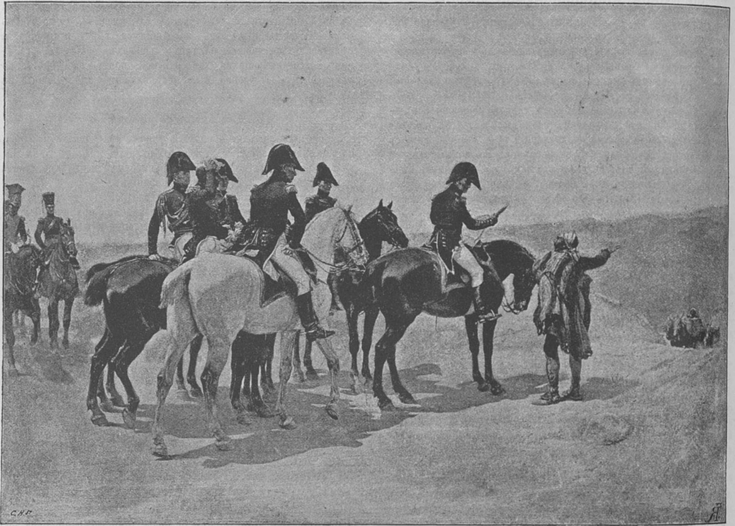
Герцогъ Веллингтонъ на рекогносцировкѣ.

Остроумные французы, не долюбивавшіе герцога, называли его не иначе, какъ «Villain-ton», передѣлавъ такимъ образомъ фамилію Веллингтона. —й.