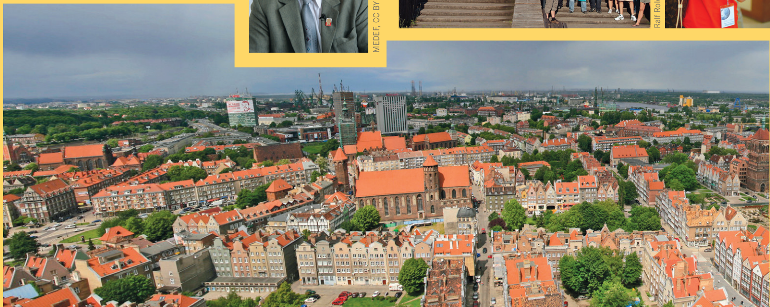
Michał Stupczewski, CC BY SA 3.0