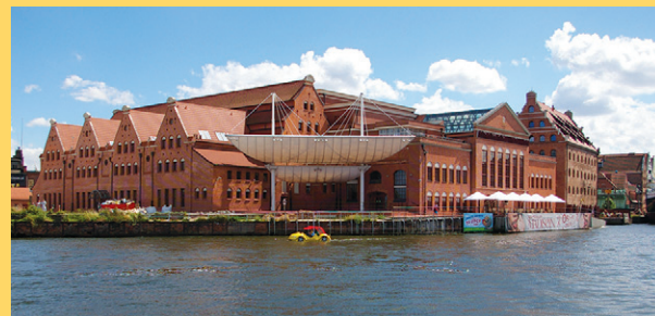
Lukasz Golowanow, CC BY SA 3.0