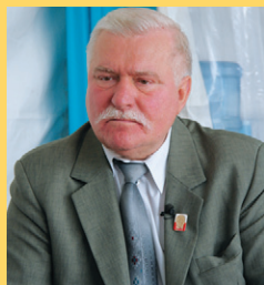
MEDEF, CC BY SA 2.0