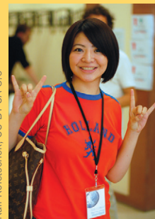
Ralf Roletschek, CC BY SA 3.0