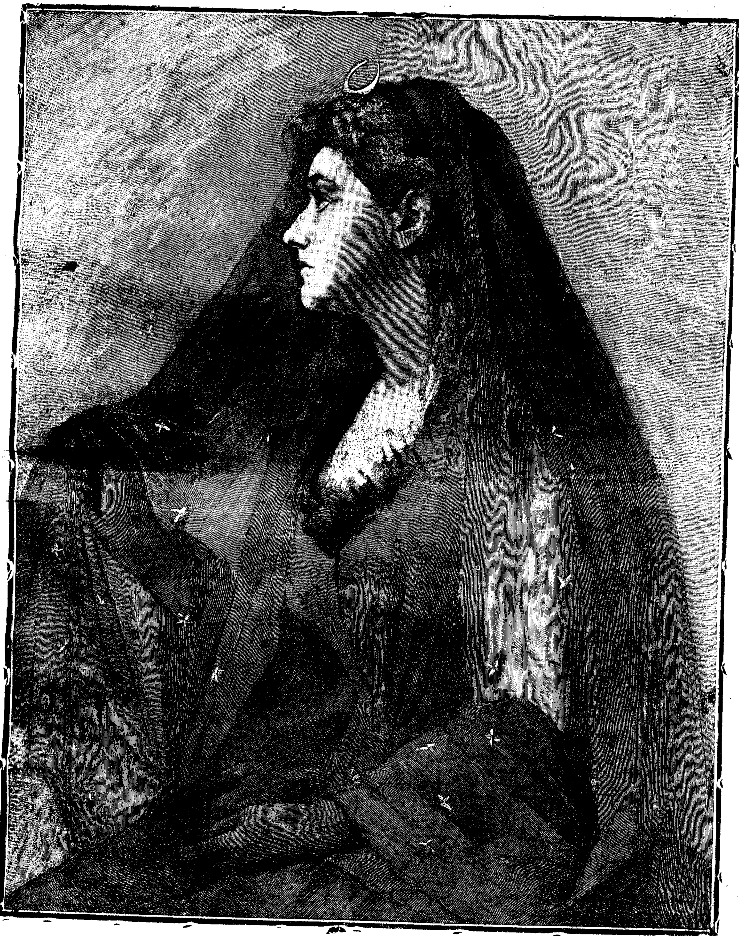
R E G I N A N O P T I I .