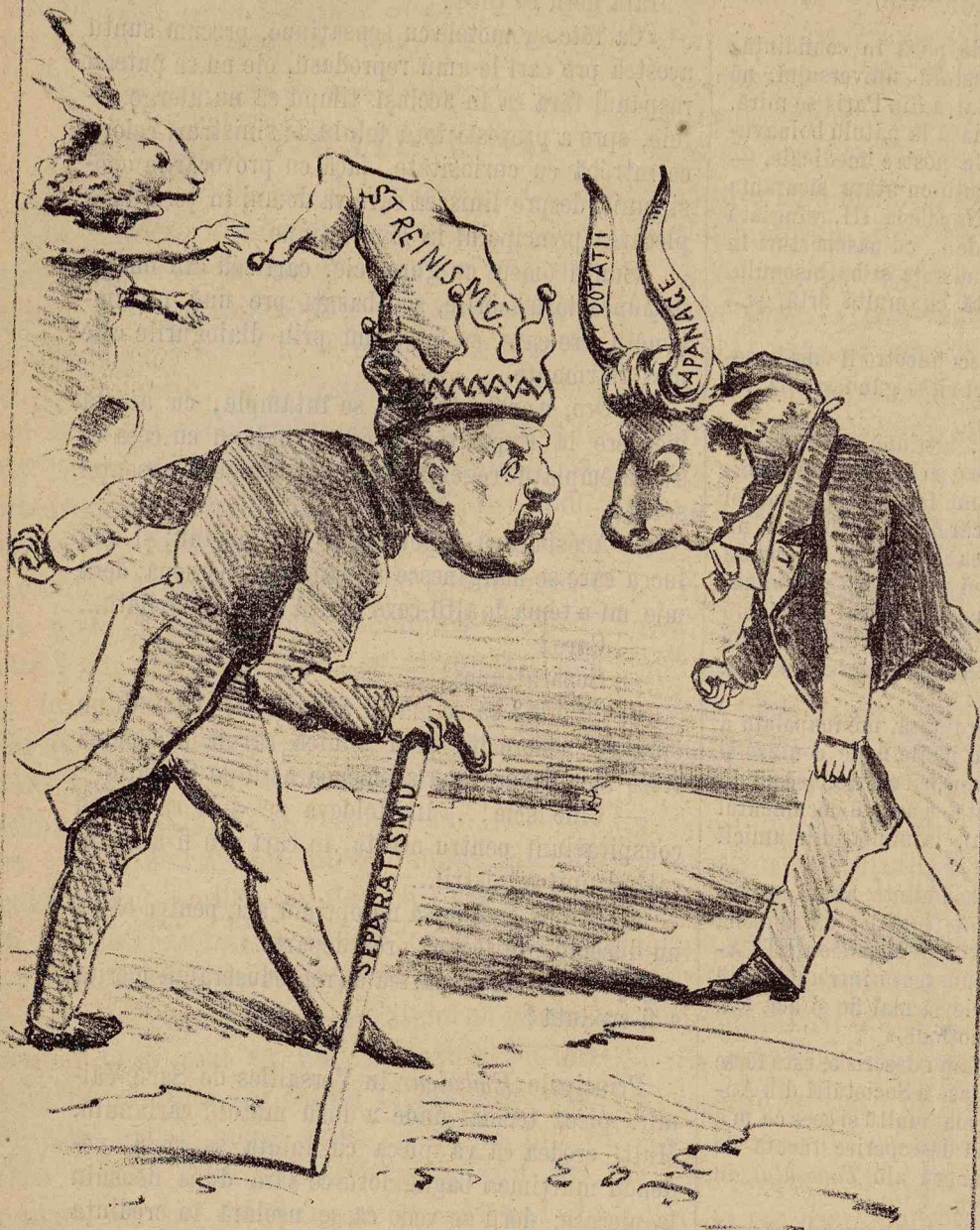
Vomū vedea care pe care.