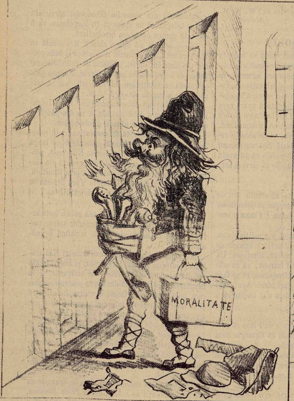
Ter taifel ih don Carlos, chindū am intratū aci am nemeritū nșā, acumū chindū ih voi să esū, nu seiū pe unde, ca să potū trece și saculū.