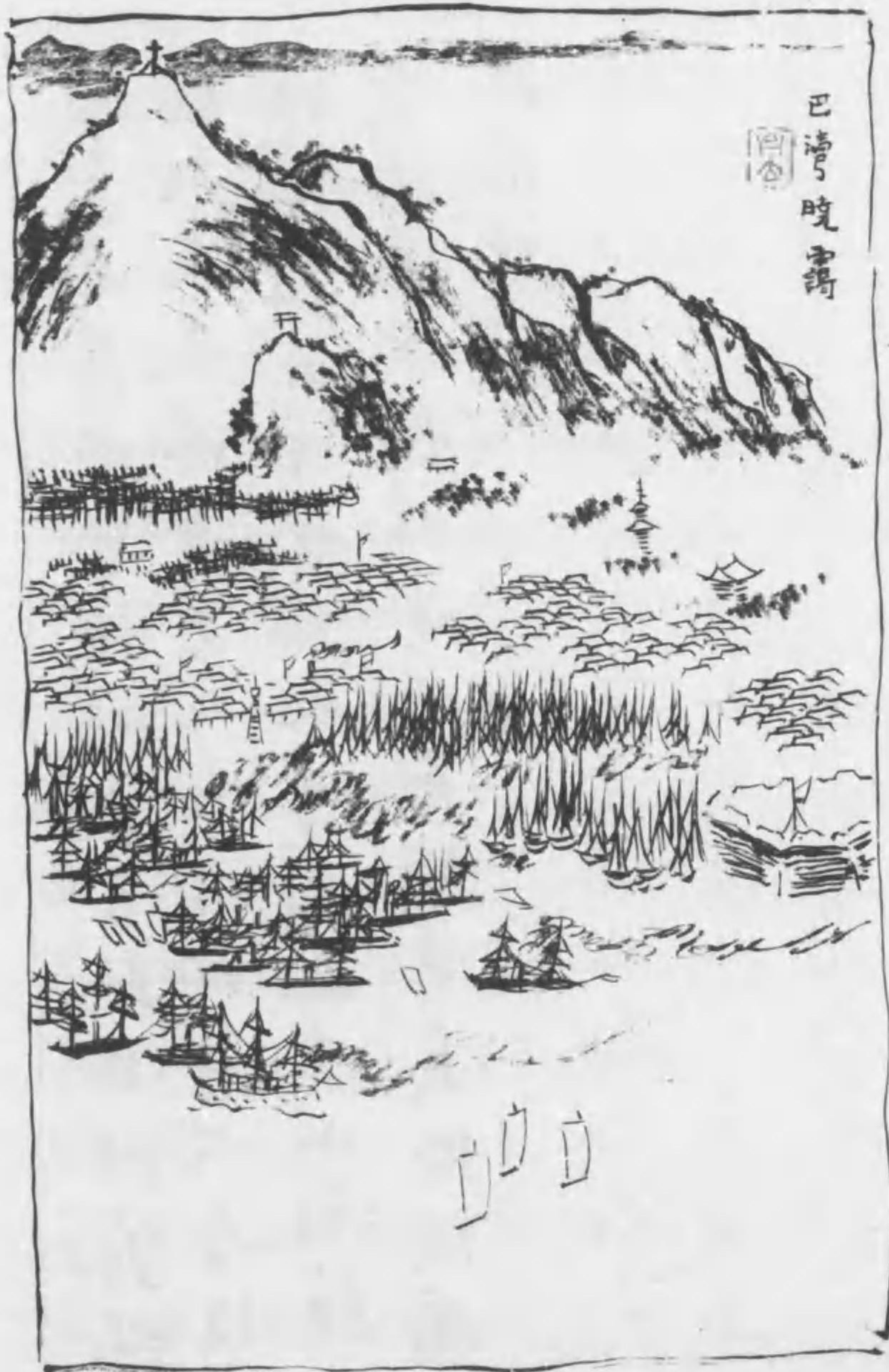
巴 清 晚 壽 閣