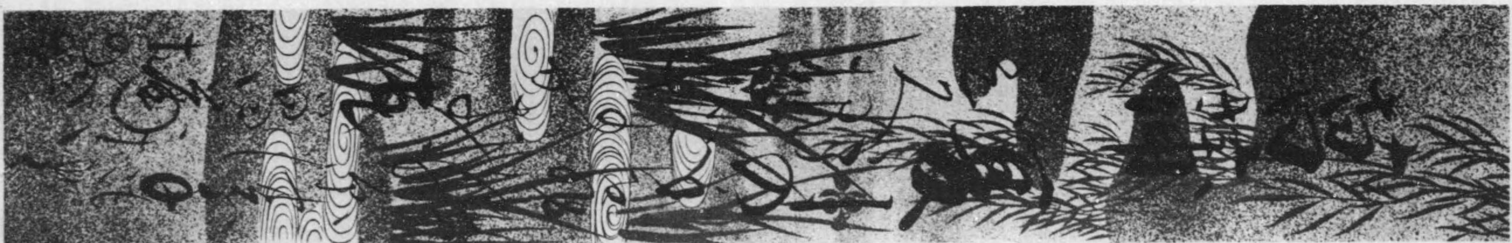
孝明天皇宸翰御短冊