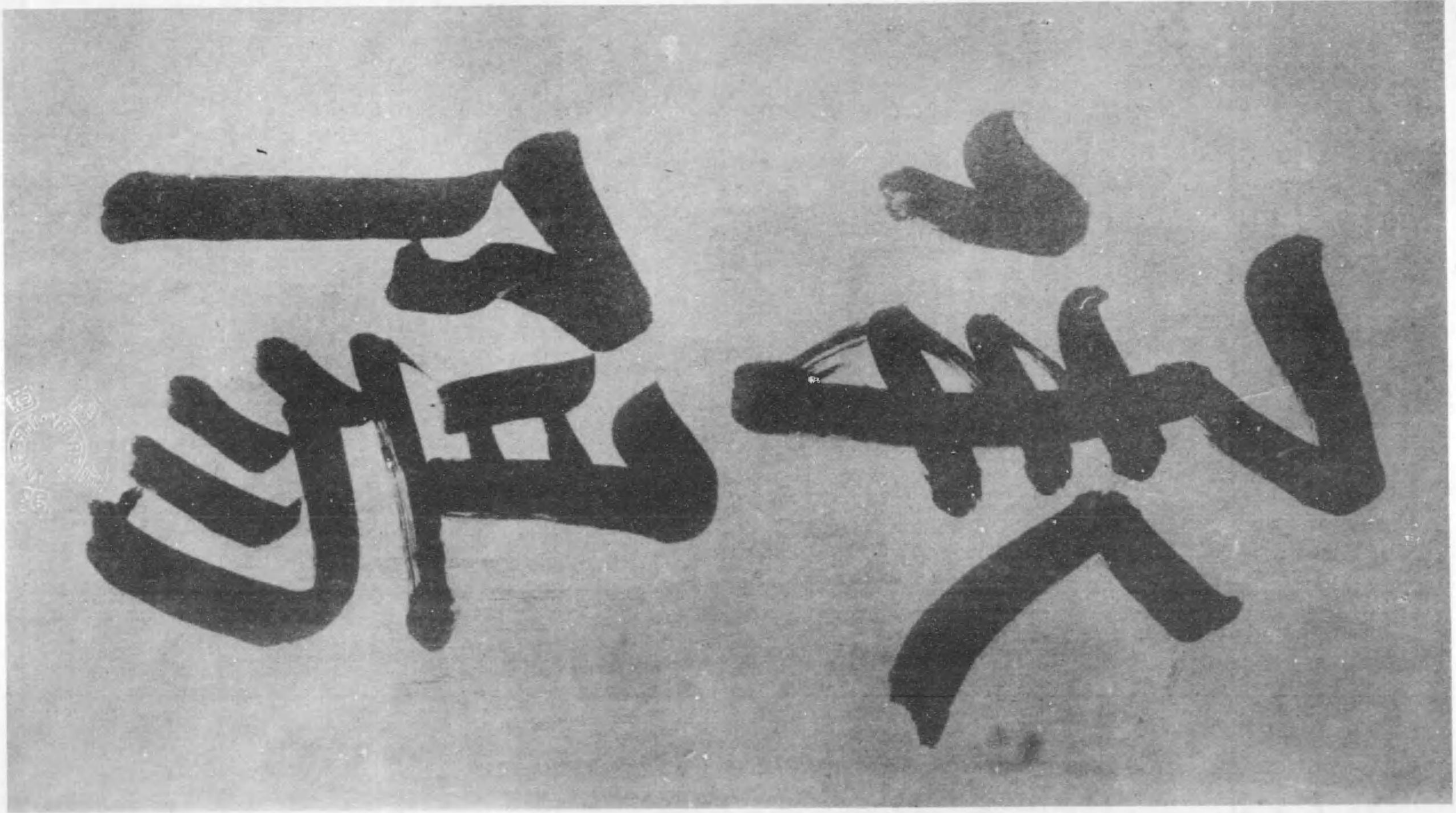
明治天皇宸翰御物額