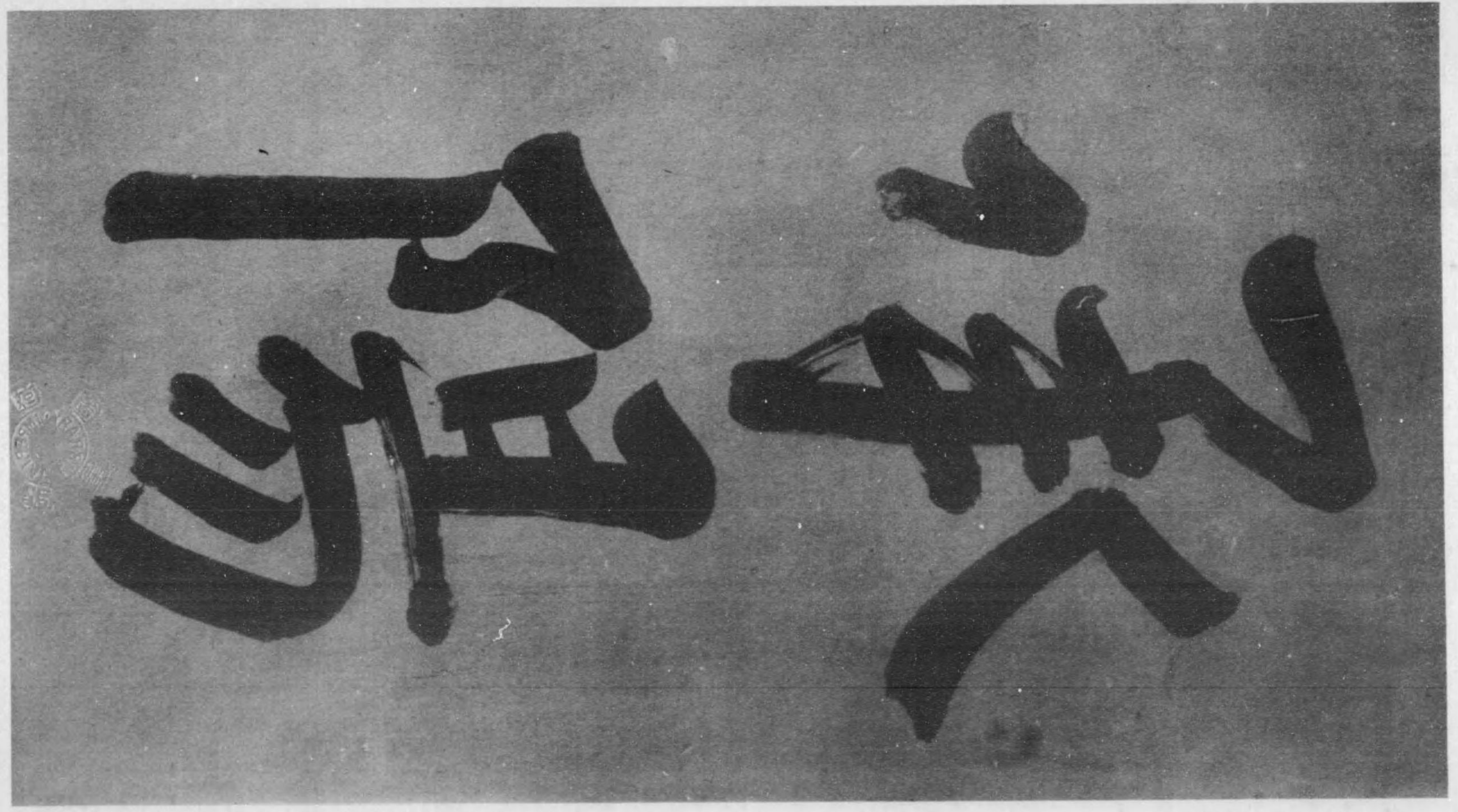
明治天皇宸翰御物額