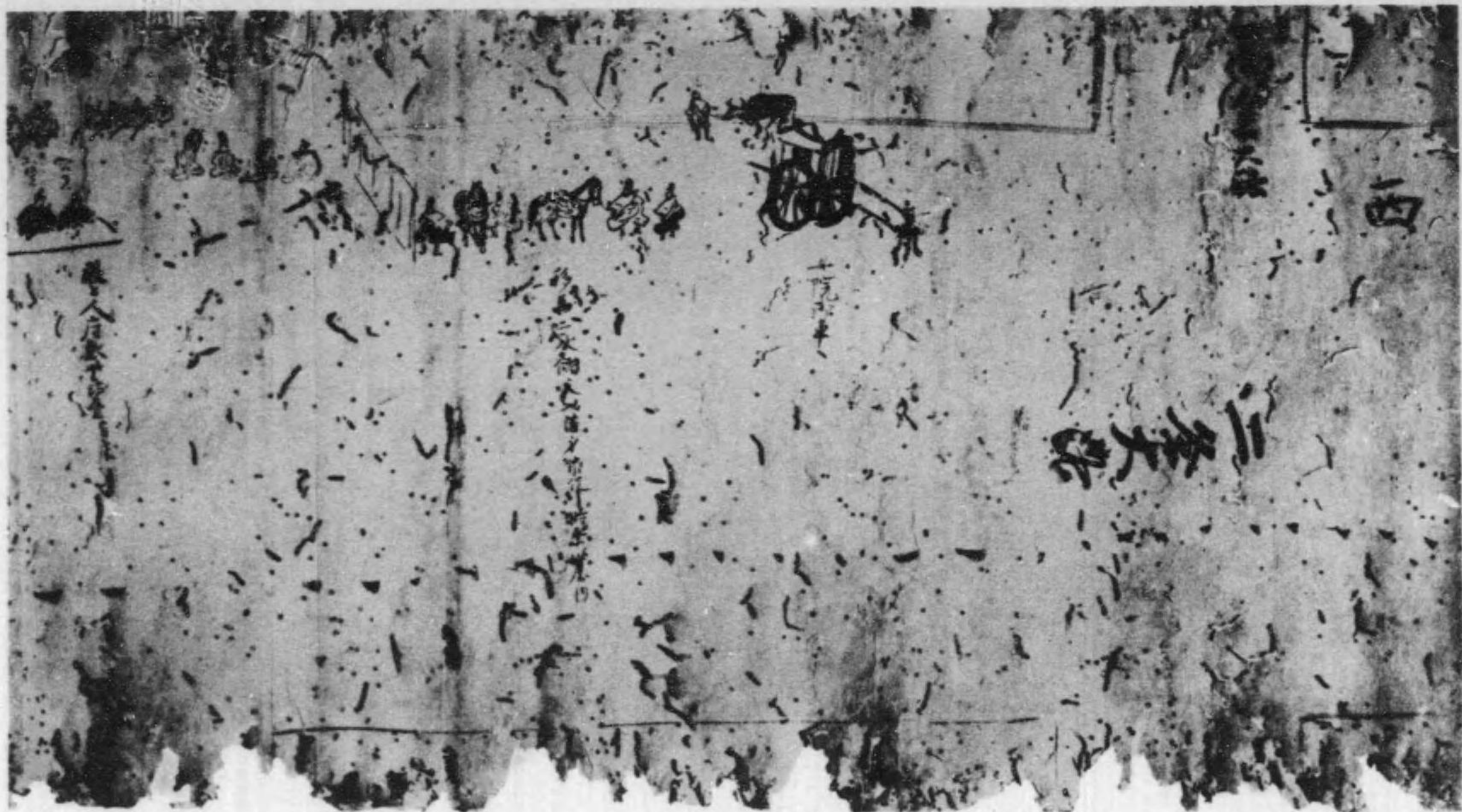
花園天皇宸筆御畫