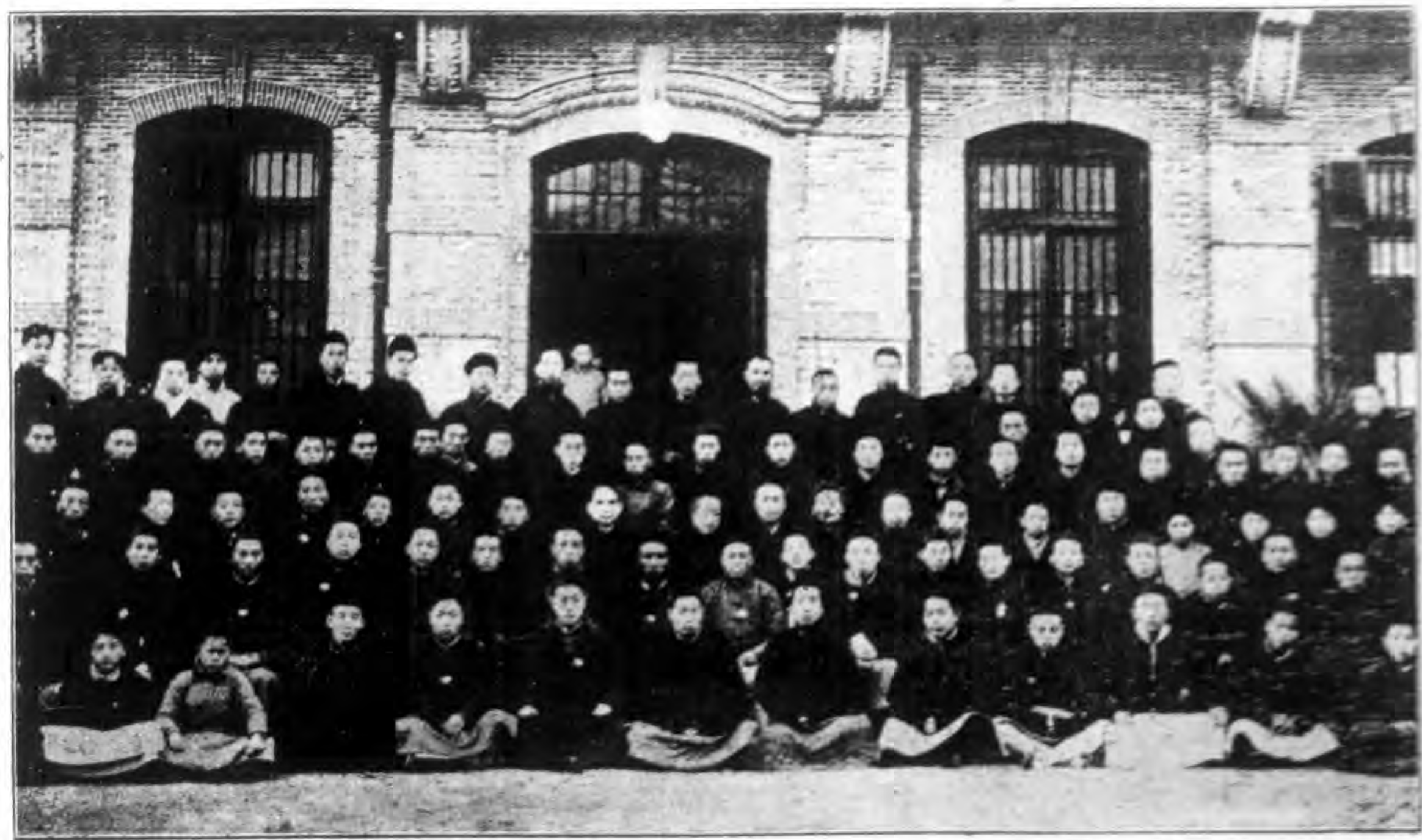
己未冬總理章太炎講演自精義後留影