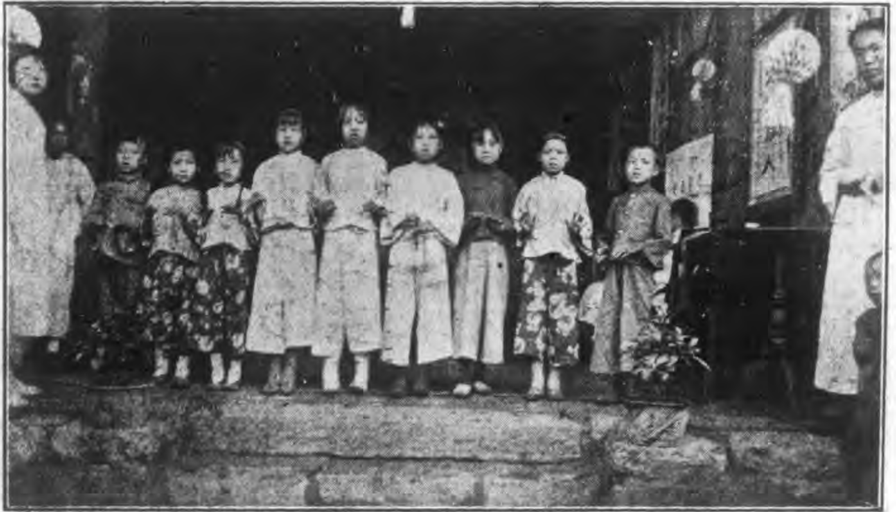
小南關兒童聖經班學生之唱歌