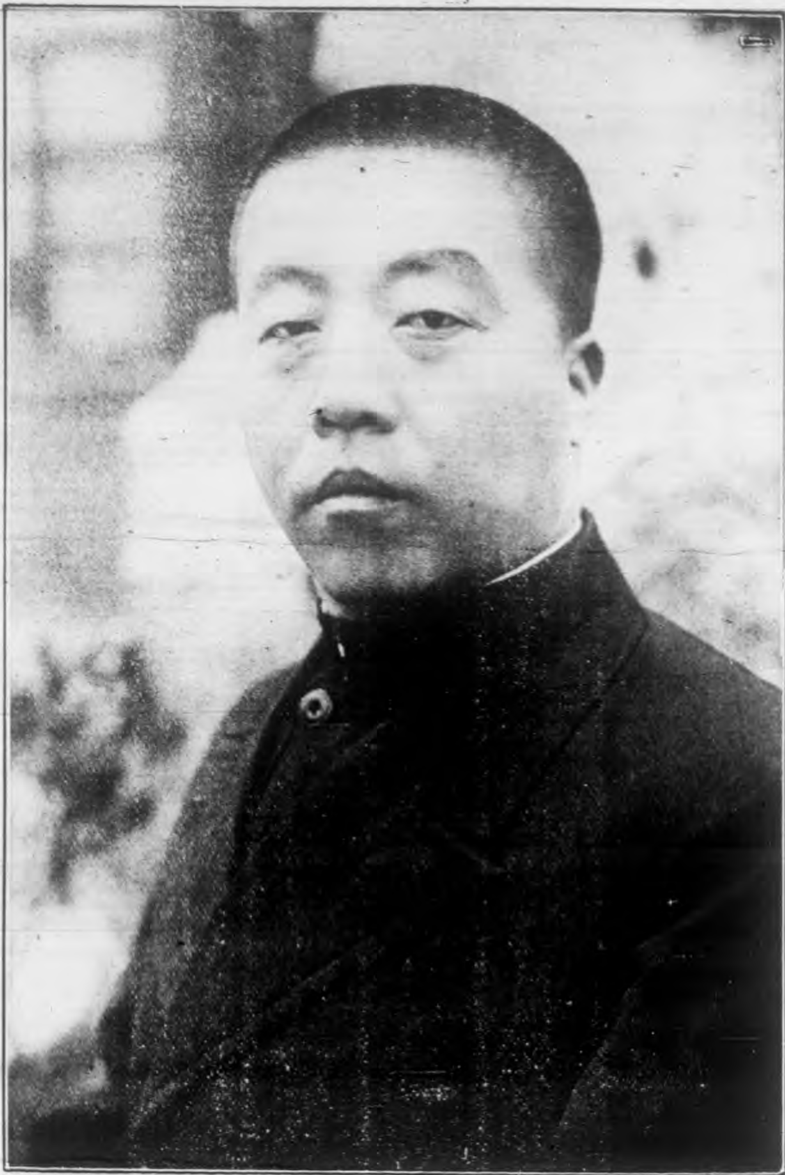
榮 向 王 長 廳