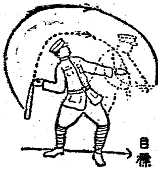
第 三 圖

上體屈向右侧面、體重移於右足、兩膝稍屈、左臂則就持槍姿勢伸直于目標方向、槍身自然舉起、此時使兩臂及身體、復歸舊位之力、作用於彈體、彈尾仍緊張、從高處投出、約成水平時、更加強力投擲、若連續投擲、均準前項要領、但安全栓之抽出、準第十六要領、若須限制彈數時、於投彈口令之下、加幾發之口令、各兵卒即照所命彈數投擲、不必準備次發之投擲、以待後命、