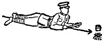
第 六 圖

兵卒將槍安置於身體左側地上、面向目標、兩膝著地、支左手於右膝前、伏臥於目標之方向、兩肘支地、依第十六之法抽出安全栓、右手握彈尾、左掌托彈體、(第六圖)