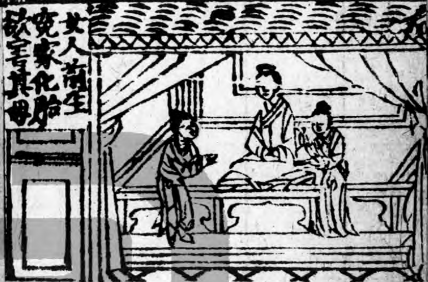
女人前生 冤家化胎 欲害其母