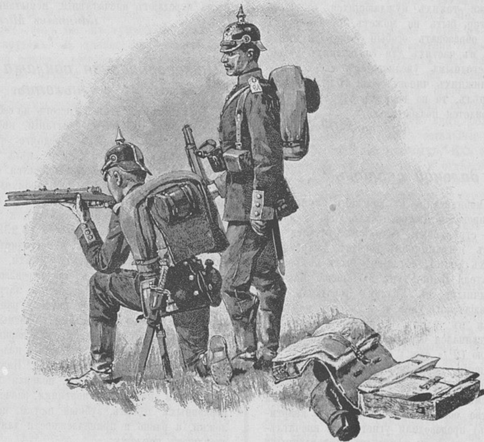
Къ статьѣ «Цѣлесообразная поклажа въ нѣмецкой пѣхотѣ.»

снаряженіе, что тотчасъ же и было исполнено. Несмотря на проливной дождь, отрядъ еле-еле въ 8 1 / 2 час. пополудни, наконецъ, пришелъ на ночлегъ и расположился бивакомъ около одной деревни. По рассказамъ жителей, въ этотъ день утромъ отсюда убѣжалъ Ляоянскій окружной казначей съ 3 милліонами казенныхъ денегъ изъ казначейства вѣроятно, узнавшій раньше какими-то судьбами о томъ, что мы идемъ сюда. Тамъ же наши казаки нашли около 20 винтовокъ, много патроновъ и пороху, зарытыхъ и закопанныхъ въ землю бѣжавшими китайскими солдатами, а между тѣмъ хунхузовъ все нѣтъ да нѣтъ, одинъ Аллахъ вѣдаетъ, гдѣ эти разбойники отъ насъ скрываются!..