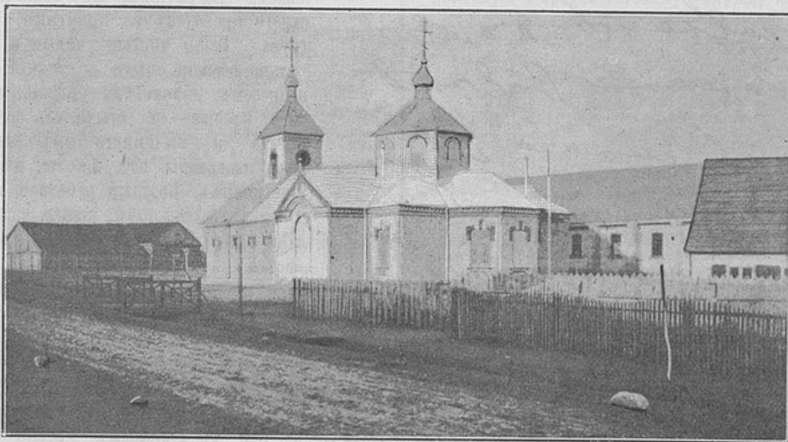
Къ сгатьѣ «Полковой храмъ Павлоградцевъ».

25-го ноября новый храмъ былъ торжественно освященъ. Затѣмъ произведенъ былъ полку церковный парадъ въ новомъ полковомъ манежѣ, въ которомъ также крайне нуждался полкъ, сооруженномъ одновременно съ церковью заботами того же командира полка, и предложено особое угощеніе нижнимъ чинамъ, потрудившимся при постройкѣ, а всѣ присутствовавшіе на семъ церковномъ торжествѣ военные и гражданскіе чины были приглашены командиромъ полка въ офицерское собраніе, гдѣ былъ сервированъ завтракъ, за которымъ, въ числѣ тостовъ, была провозглашена здравица за отца Іоанна Кронштадтскаго и послана телеграмма объ успѣшномъ окончаніи благословенной имъ постройки.