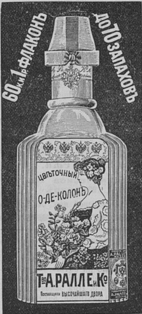
(2548) — 4

Средство для укрѣпленія луковицъ волосъ, уничтоженія перхоти и микробовъ. Благодаря ему, волосы вырастаютъ густые и крѣпкіе, что испытано долготѣлнмъ опытомъ. Цѣны флаконовъ: 2, 3, 4 и 6 руб., мыло для волосъ 20, 30 и 40 к. Разрѣшеніе Врачебной Управы за № 1036. Во избѣжаніе поддѣлокъ, исключительная продажа у изобрѣтателя Ф. Л. Грабовскаго, Варшава, Іерусалимская, 70в. Заказы принимаются отъ 2 р. на наличныя. Упаковка отъ 20 коп. Пересылка по почтовому тарифу. (2549) 3—2