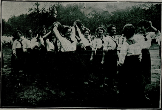
آلمانیاده کنج درنگری میدانلرندن برنده مکتبلی قیزارک طوب اوپونلری

تنبیه : طوبی دوشورن آلور ویکیدن اوپونه باشلاور. ۲ — طوبی ایکی کشی آشیرانلر تکرار آلوب اوینامغه