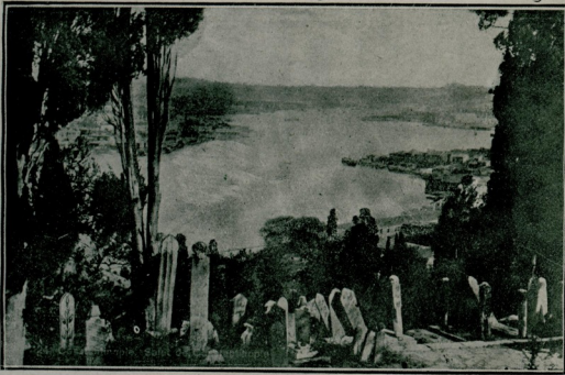
اجدادک آشیان ایدیی

یشیل چنلرک آراسنده کی بیاض طاشک آلتنده مملکتی | دایماز ، نهایت داء وطن بویوک صنعتکاری ورم دوشکنه سهون بویوک بدرک یاتپور . روحی عرش اعلاده ، | سرر . حامی نوبتلرله آتشلر ایچنده یانوب قاورولیرکن