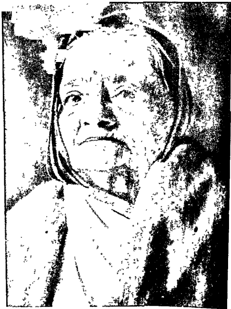
11 Dec 71