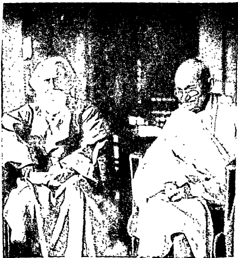
इन्दिरा टागोर साथे